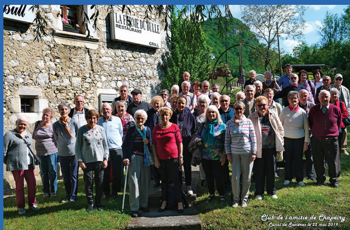
Club de l'amitié de Chapeiry Café de la Buvette le 22 mai 2019

En raison des conditions sanitaires que nous impose la circulation du virus COVID-19, les membres du CCAS n'ont pu hélas réunir nos Anciens autour du repas traditionnel habituellement organisé en début d'année.