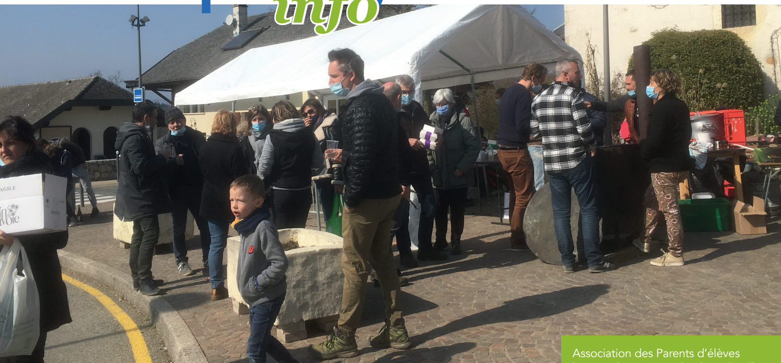
Association des Parents d'élèves le samedi 6 mars sur la place du village.