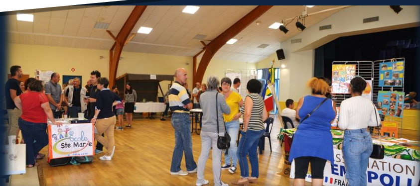
Retour sur la matinale des associations

Mercredi 27 novembre : Concours de belote – Salle Les Trois Rives – Les amis du donjon (Club des retraités).