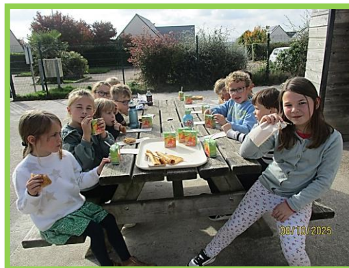
Le temps du goûter