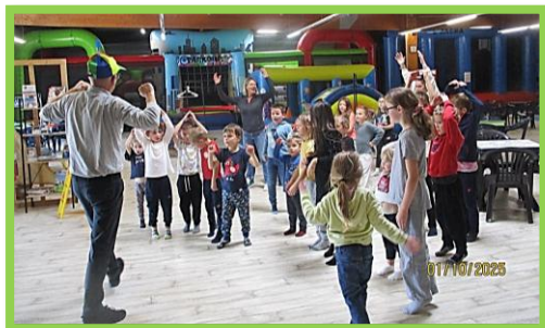
Sortie à Défoul'Parc