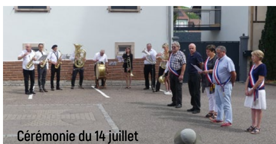
Cérémonie du 14 juillet