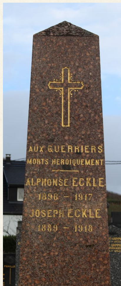
Stèle érigée dans le cimetière

« En souvenir de mes élèves tombés au champ d'honneur pendant la Guerre Mondiale (1914-1919) »