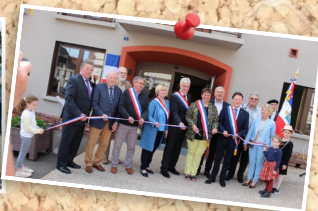
7 mai : Inauguration de la salle communale Saint-Nicolas rénovée