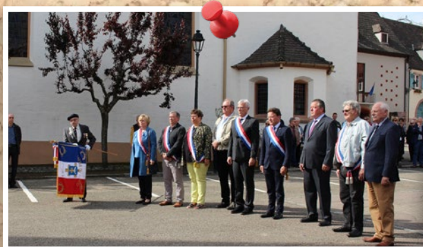
7 mai : commémoration de la fin de la Seconde Guerre Mondiale