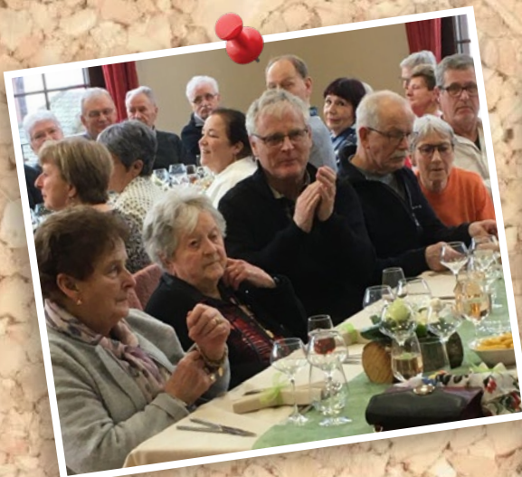
5 février : Repas des aînés