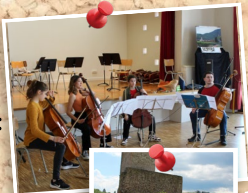
14 mai :