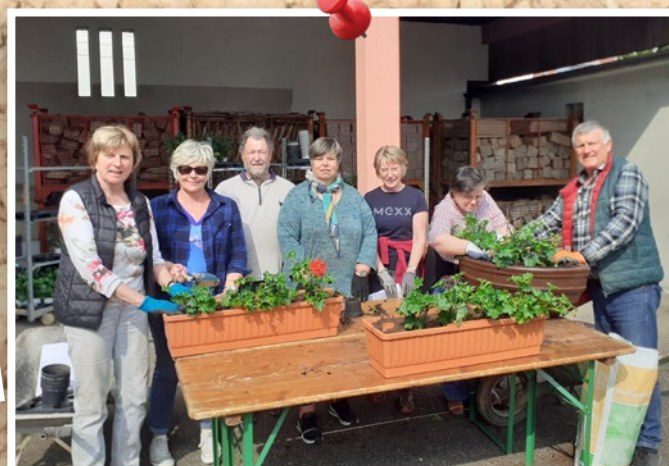
2 mai : plantation des fleurs d'été