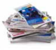
Tous les papiers