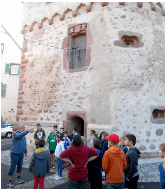
Visite de la tour des Bourgeois restaurée et ancienne Mairie.