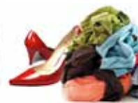
Textiles et chaussures