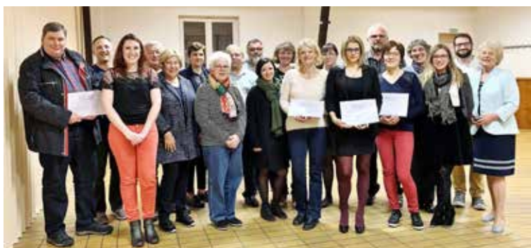
AG 2019 : les médaillés et le comité