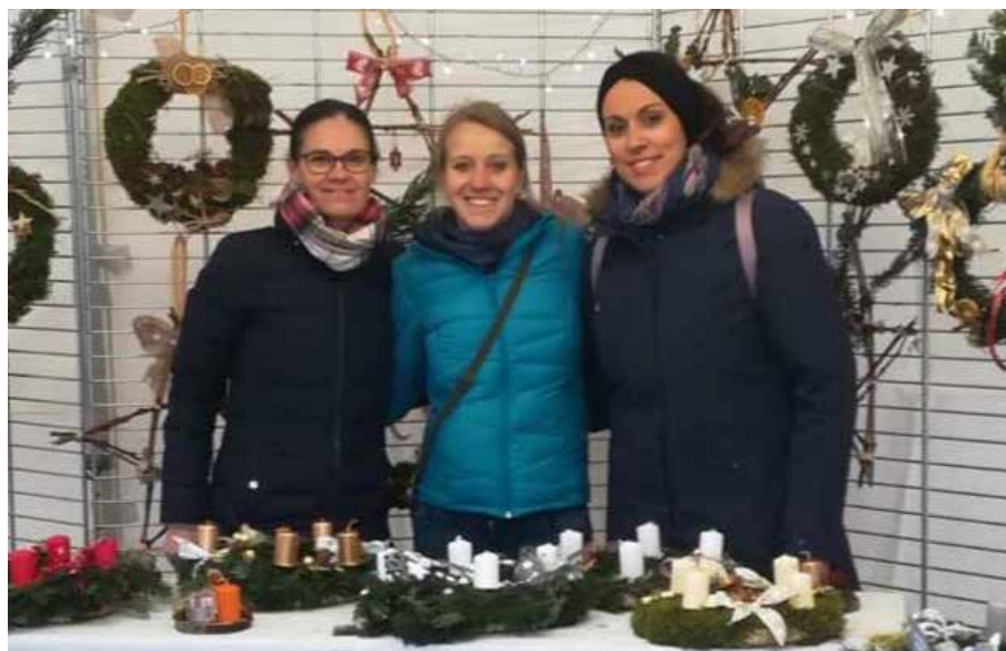
Sur le stand de l'association au Marché de l'Avent d'Ammerschwihl