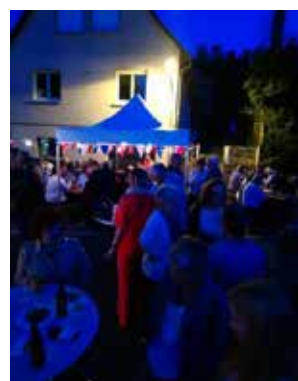
Buvette du 13 juillet

L'AFKatz remercie chaleureusement toutes les familles qui la soutiennent par leur adhésion et leurs dons, mais aussi par leur participation aux actions proposées ! Ce sont 60 foyers qui ont adhéré en 2019.