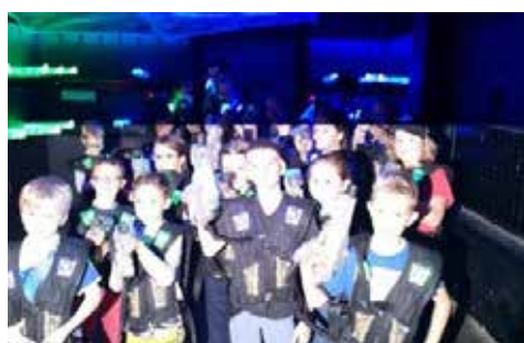
Activité au Laser Game