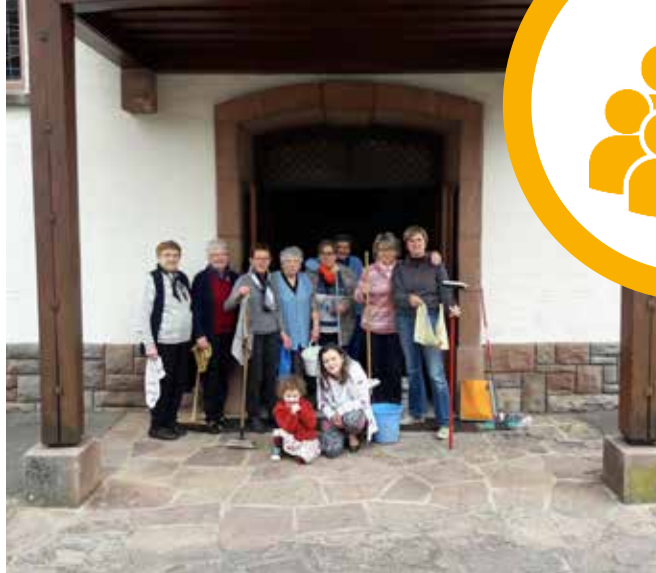
L'équipe de nettoyage de l'église

Cette année l'organisation de la « soirée tartes flambées » n'était pas possible comme les années passées du fait des travaux à la salle des fêtes. Après un long temps de réflexion, d'hésitations et de discussions, nous avons quand même opté de la reconduire sous une autre formule telle qu'elle a eu lieu le 9 août. Belle soirée empreinte de convivialité et d'amitié animée par un « musicien chanteur » ... enfin de quoi réjouir tout le monde ! Nous ne voulons pas tourner la page de cette soirée sans remercier les nombreux bénévoles, généreux donateurs, viticulteurs et pâtisseries qui ont contribué à la réussite de cette fête.