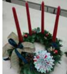
Art floral : couronne