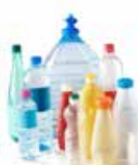
Bouteilles et flacons