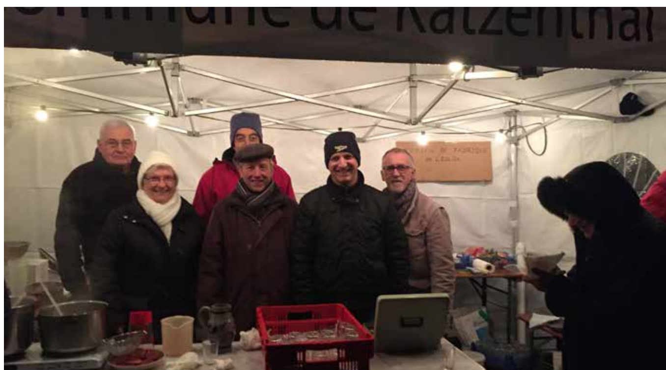
Vin chaud et bredalas proposés par le Conseil de Fabrique à la sortie du concert