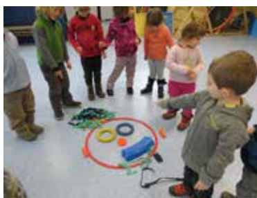
Ma tête le 17 janvier