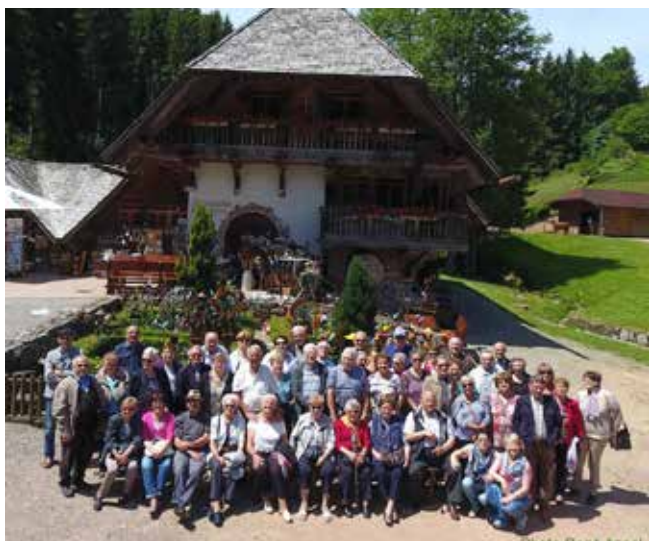
Sortie au Titisee – 8 juin