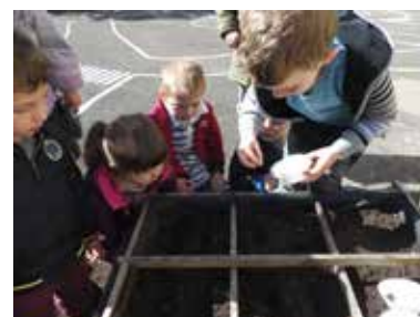
Jardinage le 2 mai