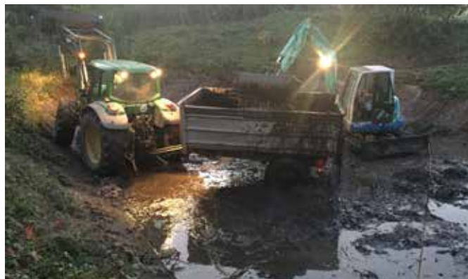
Curage dessableur rue de la Vallée