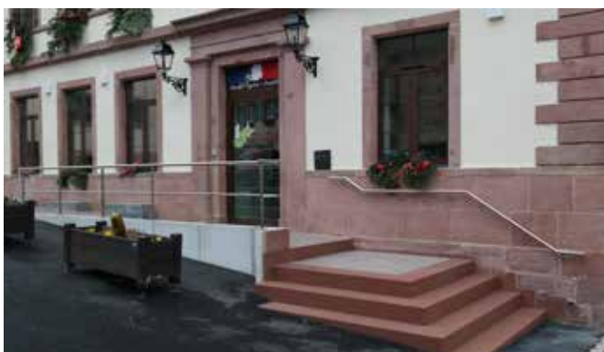
Entrée après les travaux