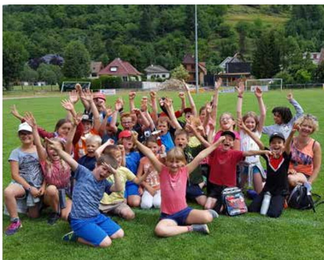
Rencontre d'athlétisme mercredi 14 juin au stade de Kaysersberg. Les CE1/CE2 vainqueurs. La coupe sera remise en jeu l'an prochain.

Course longue ! Le 20 octobre 2017, tous les élèves de CM1/CM2 du RPI Katzenthal/Sigolsheim étaient prêts pour relever un défi de taille ! Après s'être entraînée à l'école, la classe a participé à une rencontre de course longue organisée par l'USEP et qui a eu lieu au stade de Kaysersberg. Chaque enfant avait son propre « contrat » de course, la plupart ont couru, sans s'arrêter pendant 35 minutes !