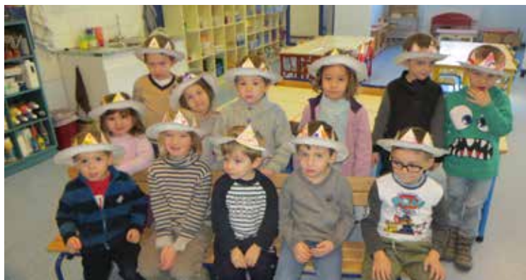
Galette des rois le 6 janvier