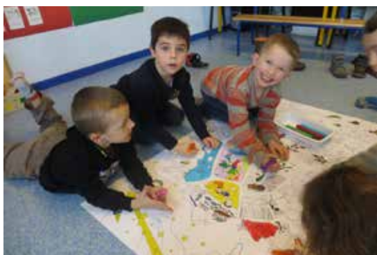
Grand coloriage le 16 janvier