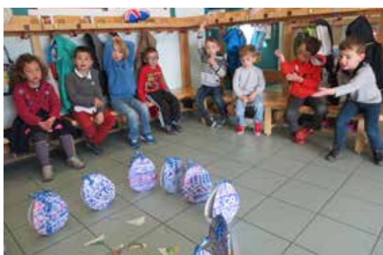
Pâques le 6 avril