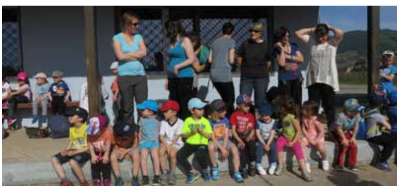
Rencontre d'athlétisme le 14 novembre