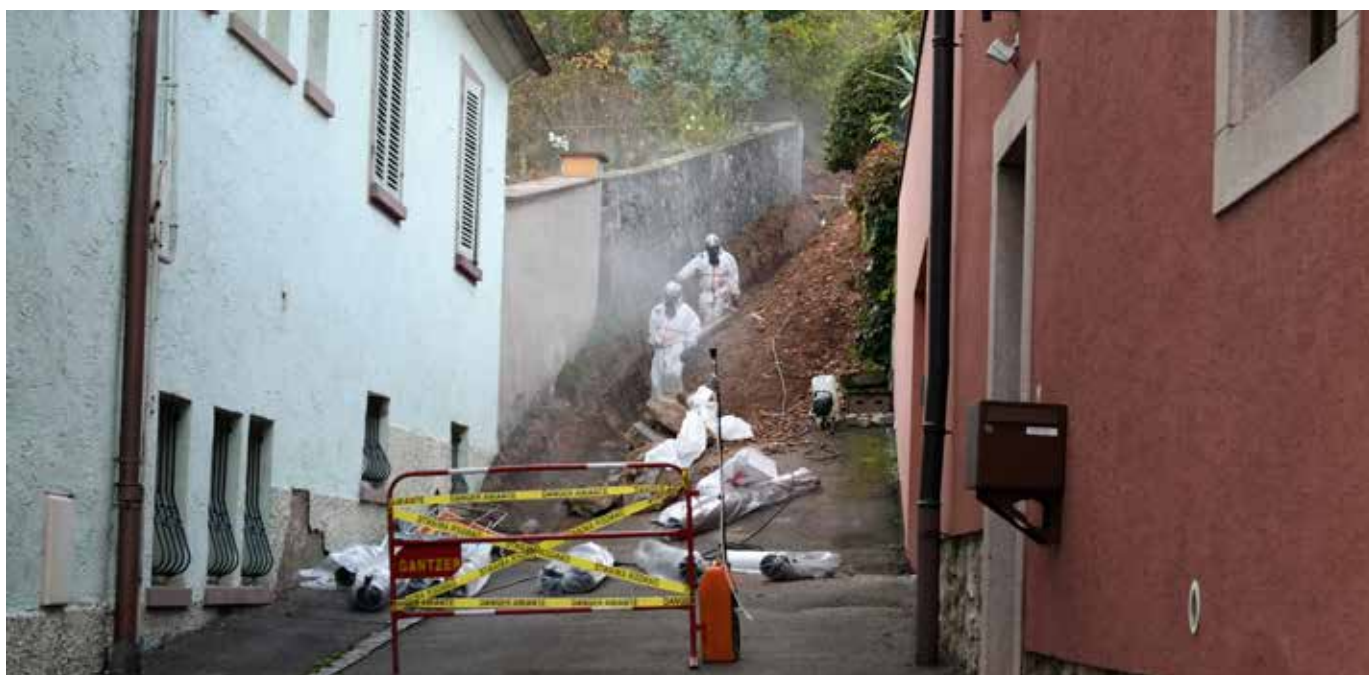
Changement de conduite de vidange du réservoir d'alimentation d'eau potable rue des Trois-Epis