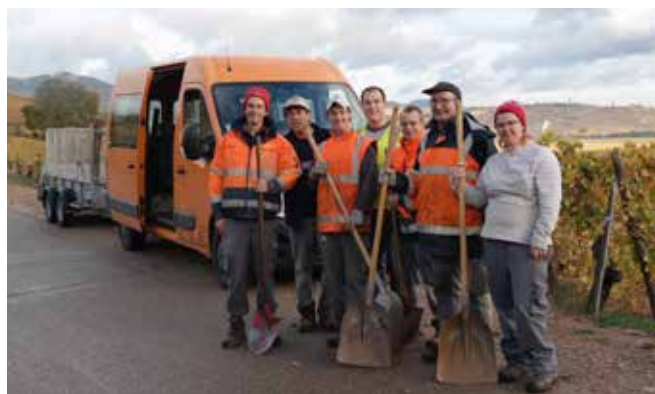
Une équipe heureuse de travailler à Katzenthal

Elle accueille les jeunes adultes sortant de l'IME (Institut Médico-Educatif) des Allagoutes, les personnes