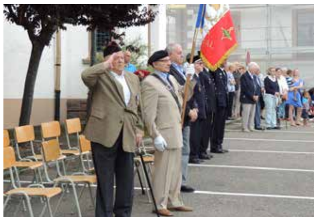
Cérémonie du 14 juillet