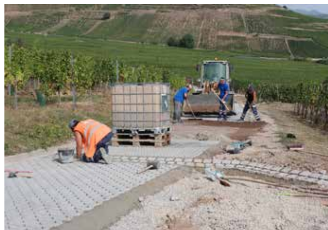
Travaux au Felsenweg