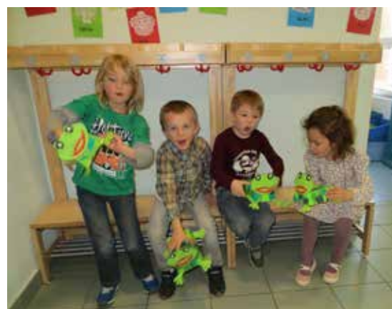
La grenouille à grande bouche le 28 mars