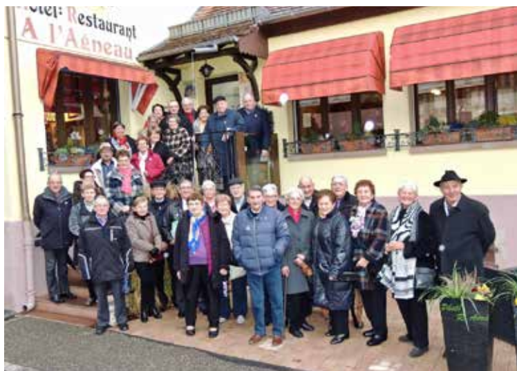
Repas du 11 novembre

Venir en aide aux camarades en situation de précarité, veuves de guerre, pupilles de la Nation. L'affectation de ces fonds est contrôlée par la Cour des comptes.