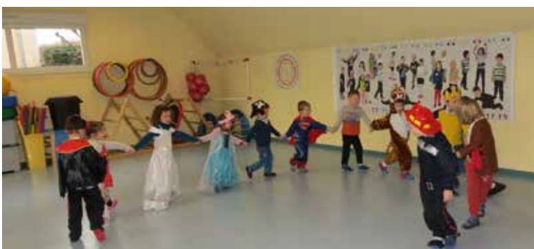
Mardi Gras le 28 février