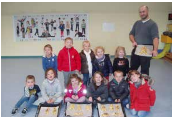
Fabrication de manalas le 13 novembre