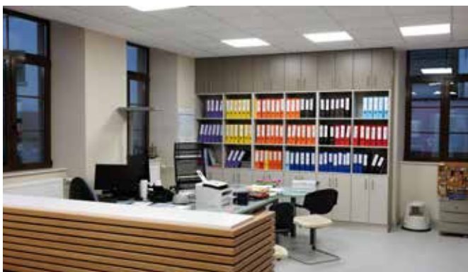
Secrétariat de mairie