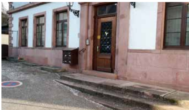
Entrée avant les travaux

de 10h00 à 12h00 et le lundi de 16h00 à 19h00.