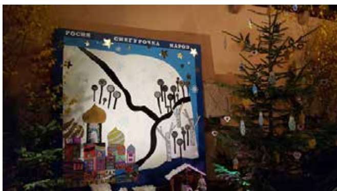
Participation au marché de Noël de Kaysersberg sur le thème du conte russe « La petite fille des neiges ».