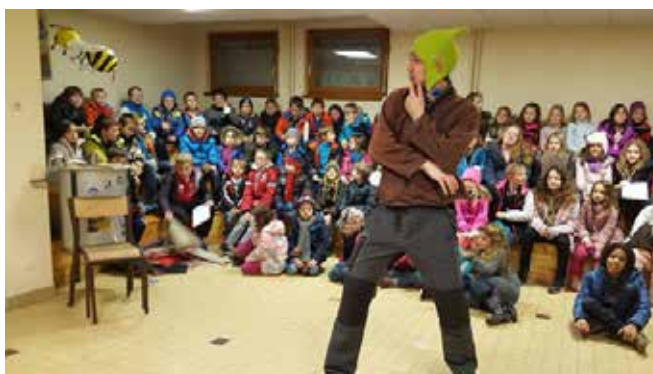
La classe de découverte au centre permanent des PEP « la Roche » à Stosswihr pour les 3 classes élémentaires. De nombreuses découvertes avec les visites d'une chèvrerie, la fabrication du munster, des raquettes aux Trois Fours, des randonnées au Katzenstein, étude des oiseaux et ichnologie (étude des empreintes d'animaux...et des veillées en français et en allemand.

Un travail sur l'alimentation en classe, et à l'école avec l'opération « un fruit à la récré » a permis de rappeler les bonnes habitudes alimentaires.