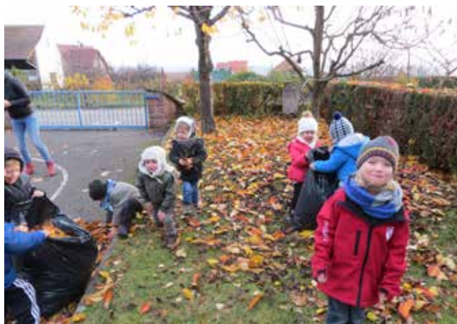
Ramassage des feuilles d'automne