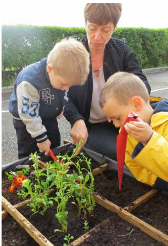
Plantations de printemps