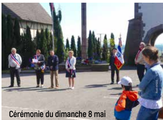
Cérémonie du dimanche 8 mai