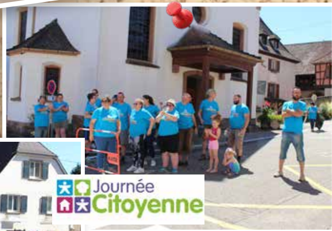
2 juillet : Journée citoyenne