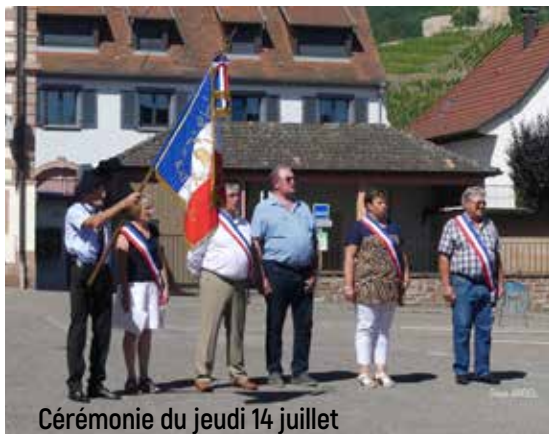
Cérémonie du jeudi 14 juillet