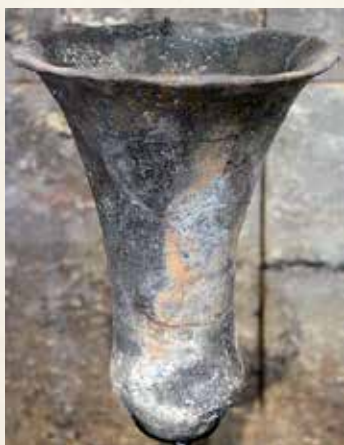
Trois types de récipients ont été trouvés dont un vase en forme de tulipe qui peut être daté du néolithique récent, culture de Michelsberg entre 3500 et 3000 avant J.-C

Les techniques de fouilles de l'époque étaient très éloignées des méthodes actuelles et les conclusions plutôt hasardeuses.