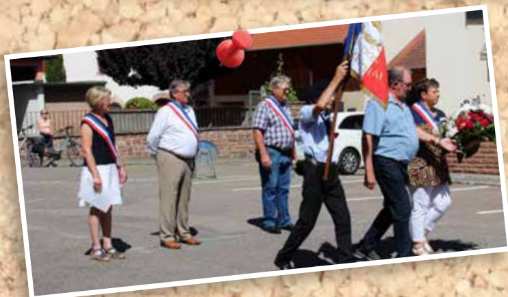
14 juillet : Cérémonie officielle de la Fête nationale