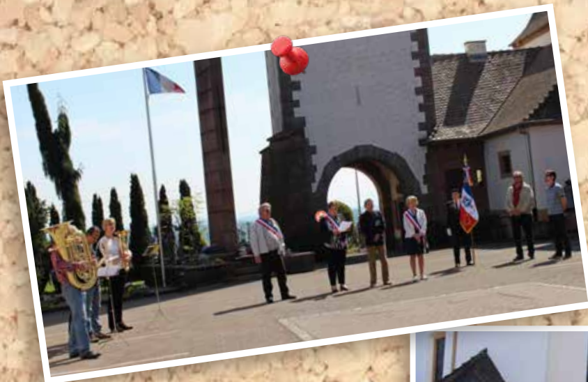
8 mai : Commémoration de la fin de la Deuxième Guerre Mondiale