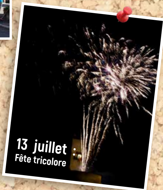
13 juillet : Fête tricolore