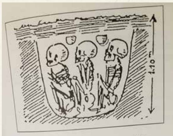
Les céramiques et les crânes font partie de la collection Winkler du Musée Historique de Mulhouse