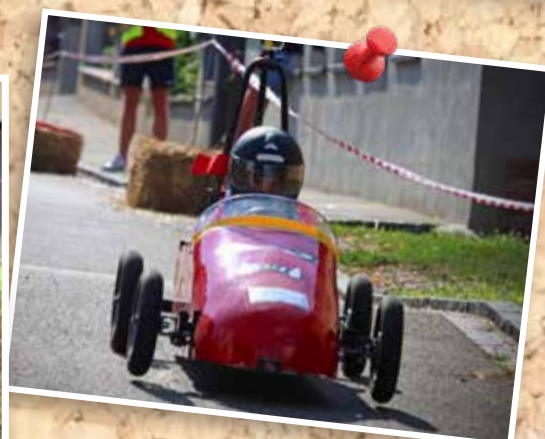
28 août : Course de caisses à savon