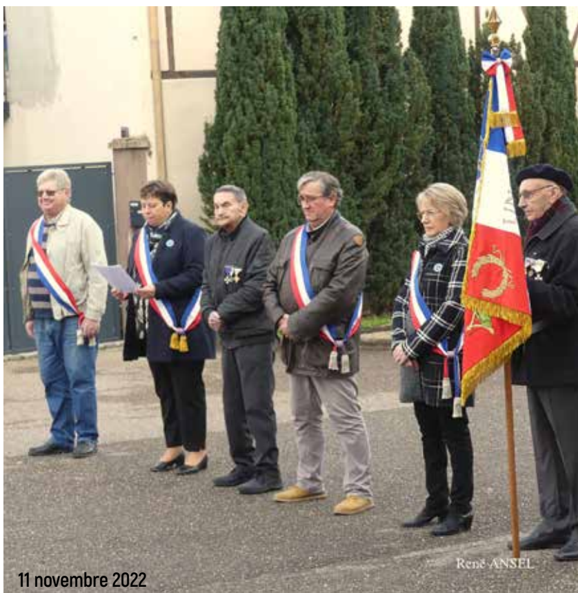
11 novembre 2022