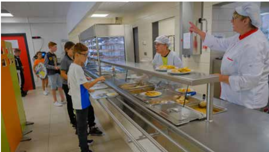
Rénovation de la demi-pension du collège Albert Schweitzer à Kaysersberg pour un montant de 1,16 M€.