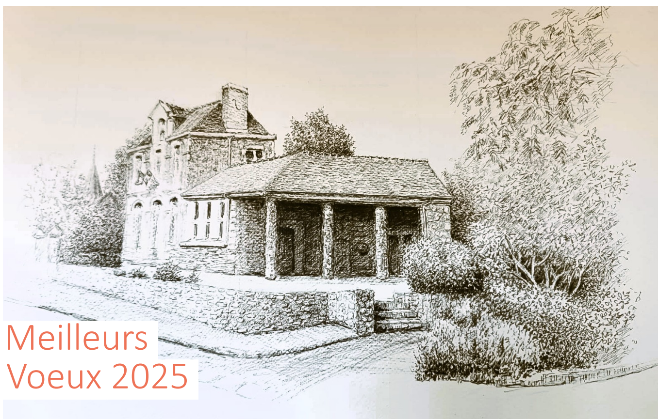
Dessin de la Mairie d'Aubigné à l'encre sepià, travaillé à la plume par Syphol Moeur - Couleurs de Bretagne - septembre 2023

Janvier > Mai 2025 • Bulletin municipal d'information • Plus d'info sur www.aubigne.fr