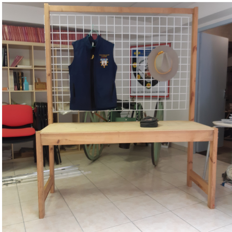
Support bois avec fond métallique.

L'ACAUP vous offre la possibilité d'équiper l'arrière de votre stand pendant la durée du salon. Deux types de structures peuvent être mises à disposition (tarif indiqué sur les feuilles d'inscription).