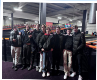
23 mai 2025 Soirée Karting