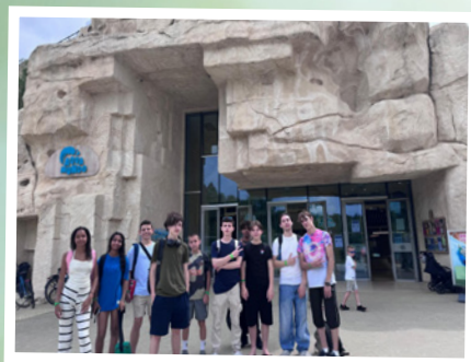
14 juin 2025 Sortie aux Villages Nature