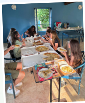
13 juin 2025 Soirée Jeux cm2