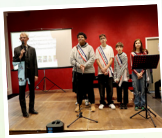
Cérémonie des vœux du Maire Janvier 2025