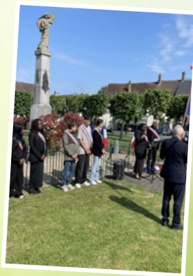
Commémoration Mai 2025