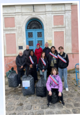
Collecte des bouchons Septembre 2024