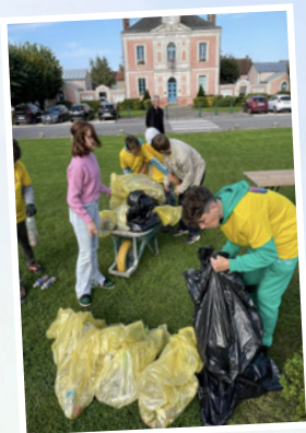
World Cleanup Day Septembre 2024