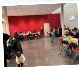
Après-midi jeux de société Février 2025