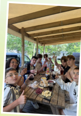
Juillet 2025 Voyage à Sanguinet