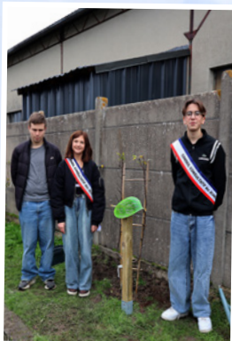
Plantation de l'arbre de naissances Septembre 2024