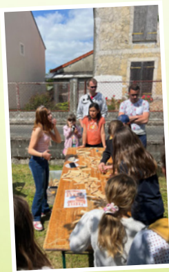
Chasse au trésor Mai 2025