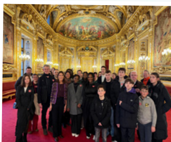
Visite du Sénat Janvier 2025