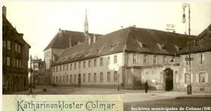
Katharinenkloster Colmar. Lehrerweisenbazar, November 1897.

Mais la querelle perdure et en 1288, le couvent est transféré à Ammerschwihr (Les caves Adam aujourd'hui) puis en 1312, à Colmar. C'est le couvent des Dominicaines Sainte-Catherine ; les « Catherinettes » en référence à ses débuts à Katzenthal. Celui-ci restera jusqu'en 1792.