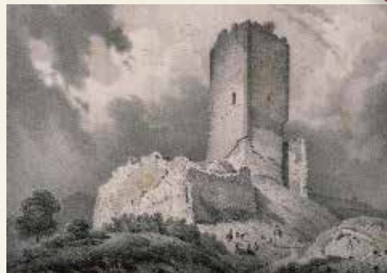
Vue du Schlessla au sortir de la Guerre