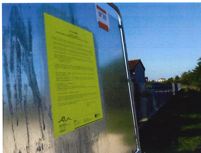
Avis d'enquête publique Affichage réalisé dans différents emplacements de la commune (Photo prise Chemin du Moncel

Les attestations de publication dans la presse locale de l'annonce de cette enquête, à savoir dans « Le Progrès » du 8 septembre et du 3 octobre et dans « La Tribune de Lyon » du 11 septembre et du 2 octobre m'ont été remis (copies en annexe)