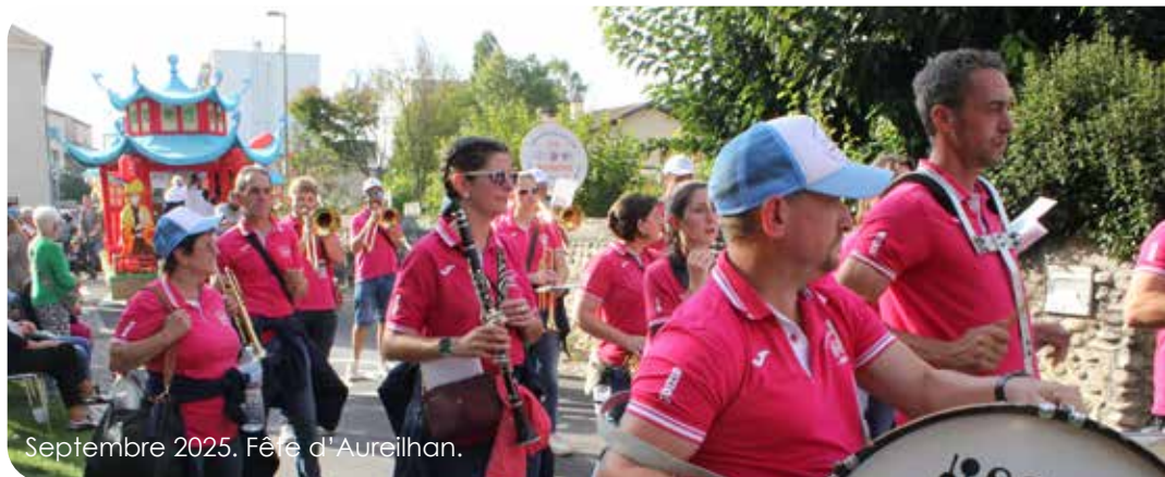
Septembre 2025. Fête d'Aureilhan.

Pour feuilleter le Guide des Associations en ligne, scannez le QR code