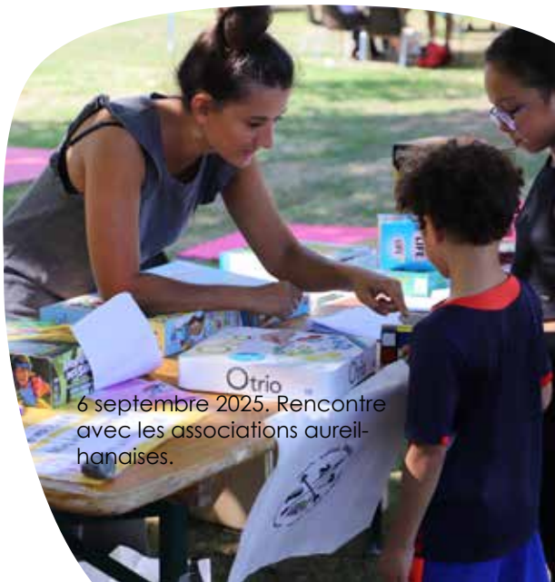
6 septembre 2025. Rencontre avec les associations aureilhanaises.