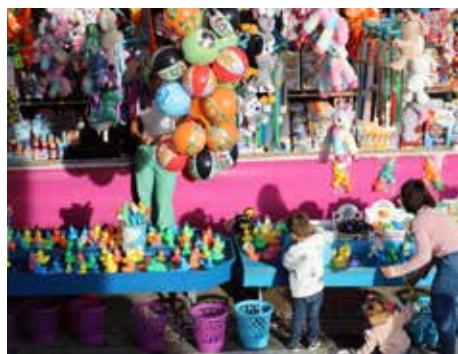
Fête foraine 2025.