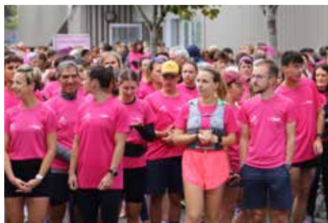
Octobre Rose 2025.