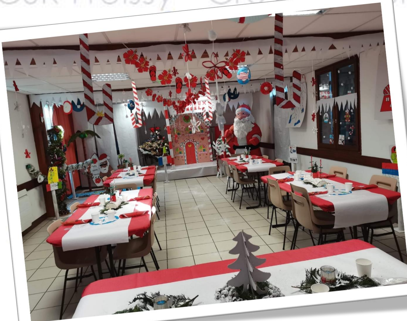
Cantine de Domeliers