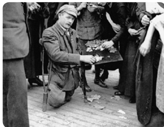
Paris, mutilé de guerre, 14 juillet 1919

Créé au lendemain de la Première Guerre mondiale, le Bleuet de France procure des ressources financières aux anciens soldats mutilés et blessés. Devenus une véritable institution, les bleuets continuent d'être vendus pour «aider ceux qui restent».