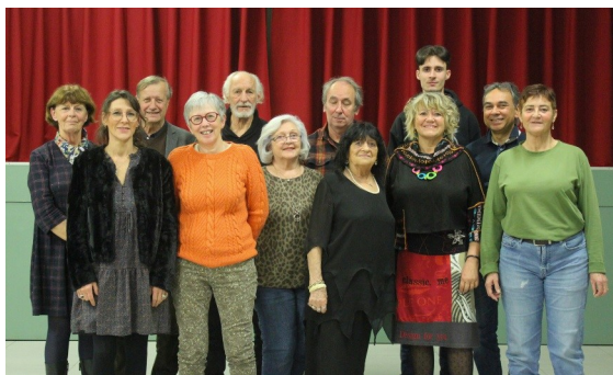
Le président et la troupe Les Tréteaux du Soir