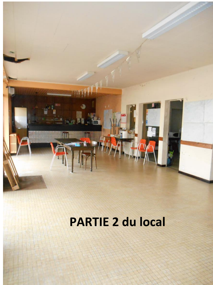
PARTIE 2 du local