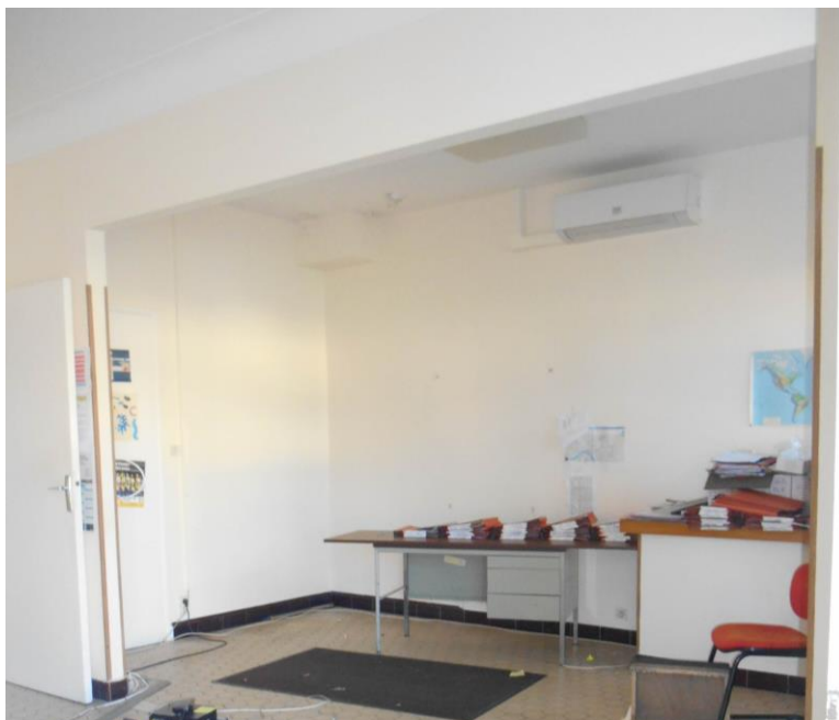
PARTIE 1 du local