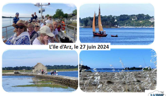
L'île d'Arz, le 27 juin 2024

Les randonnées cyclistes ont lieu quant à elles tous les lundis de l'été au départ de l'office du tourisme à 9h. Là encore, un beau succès.