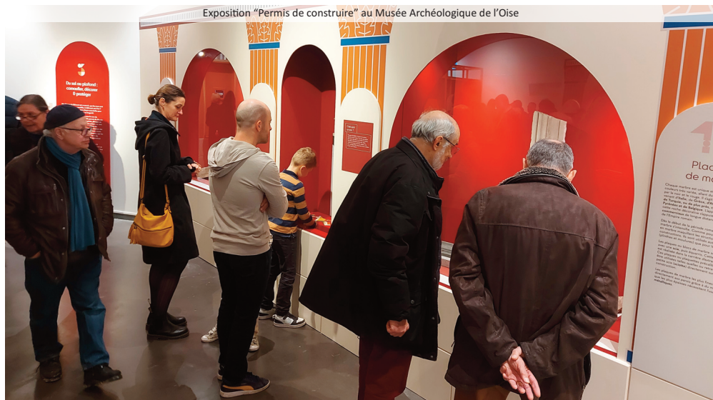
Exposition "Permis de construire" au Musée Archéologique de l'Oise