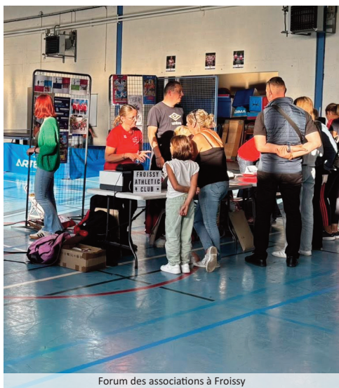
Forum des associations à Froissy