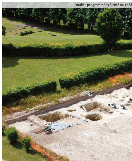
Fouilles programmées à côté du théâtre