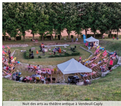
Nuit des arts au théâtre antique à Vendeuil-Caply