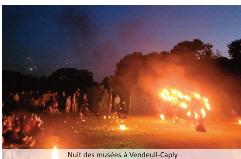
Nuit des musées à Vendeuil-Caply