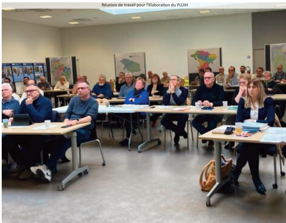
Réunion de travail pour l'élaboration du PLUIH