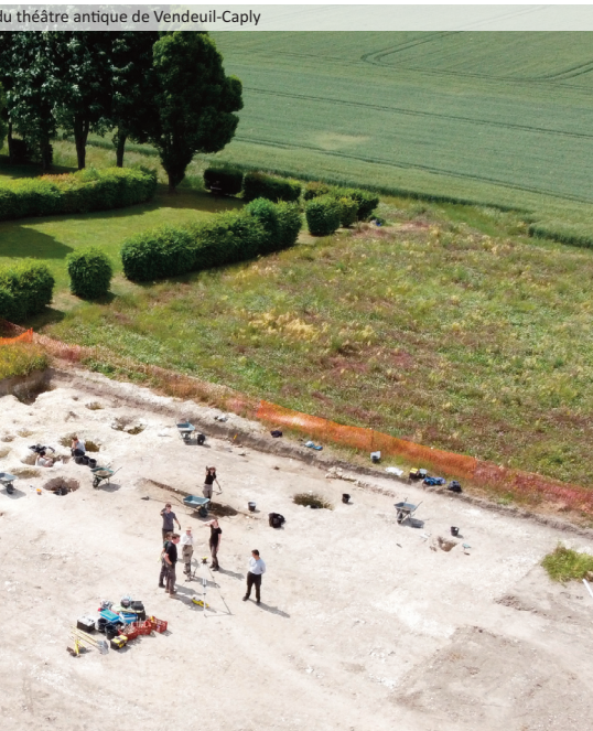
du théâtre antique de Vendeuil-Caply