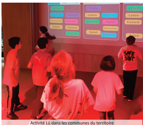
Activité Lû dans les communes du territoire