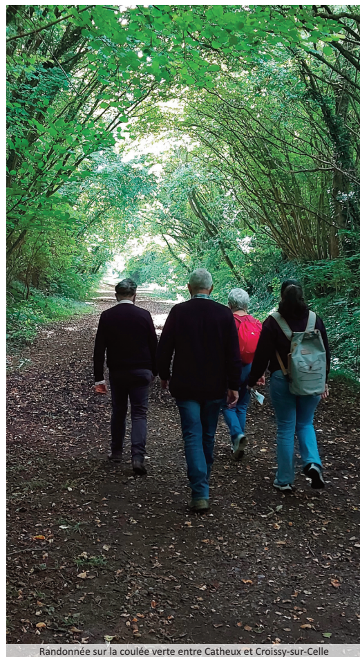
Randonnée sur la coulée verte entre Catheux et Croissy-sur-Celle