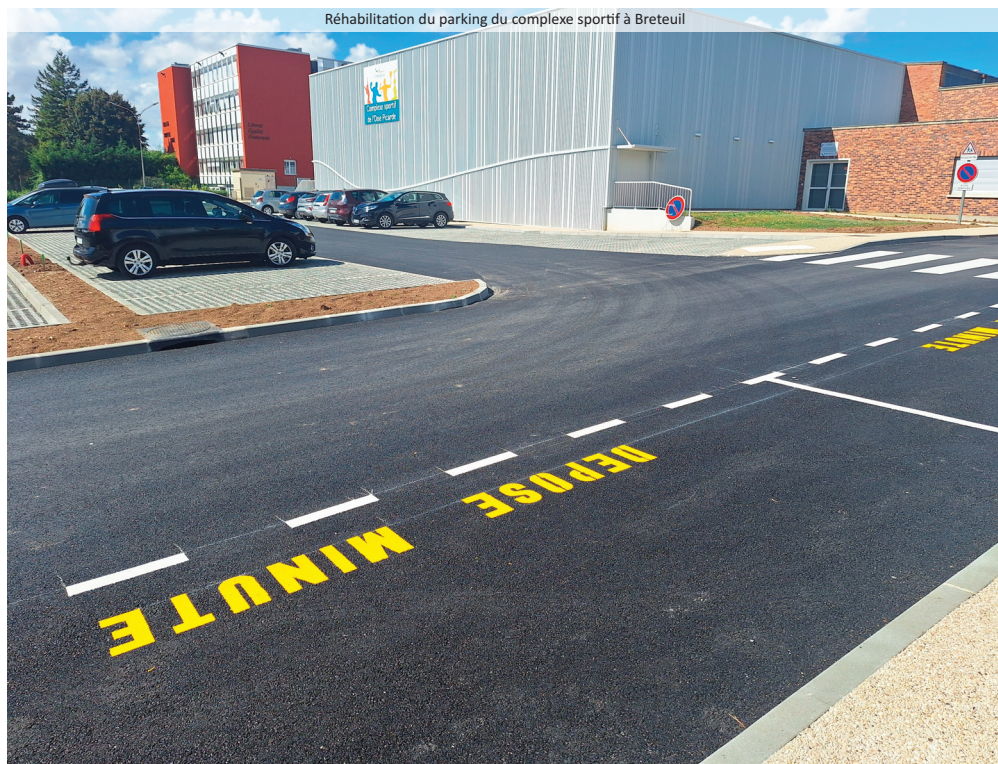
Réhabilitation du parking du complexe sportif à Breteuil