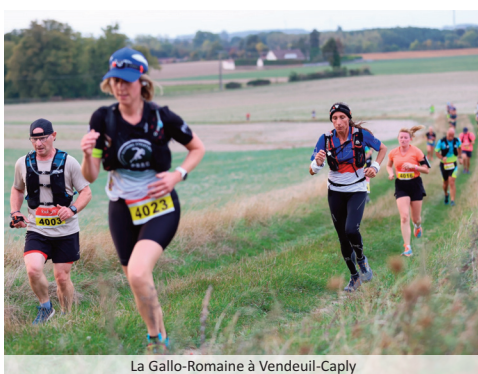
La Gallo-Romaine à Vendeuil-Caply