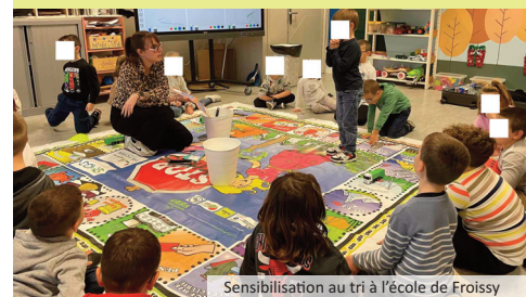
Sensibilisation au tri à l'école de Froissy

Ensemble, continuons à transmettre les bonnes pratiques pour construire un avenir plus propre et responsable !