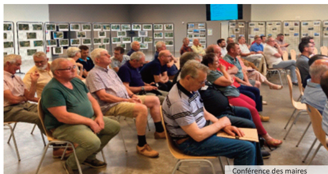
Conférence des maires