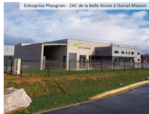
Entreprise Phyto Grain - ZAC de la Belle Assise à Oursel-Maison

Il découle plusieurs constats de ces échanges avec les dirigeants: La grande majorité des entreprises estiment bénéficier d'un bon ancrage local leur permettant de poursuivre leur développement sur le territoire de l'Oise Picarde mais certaines entreprises éprouvent des difficultés de recrutement sur des profils techniques (caristes, soudeurs, régleurs machines à commande numérique, techniciens de maintenance...).