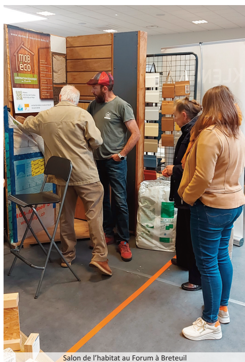
Salon de l'habitat au Forum à Breteuil