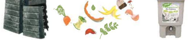
Composteur de 400 à 1000 litres en plastique recyclé