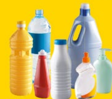
bouteilles / bidons / flacons