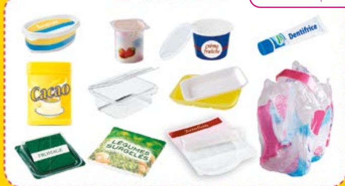
pots / barquettes / boîtes / sachets / films

Merci de séparer les opercules et les films plastiques des pots (yaourts, crème...) et des barquettes (jambon, viande...)