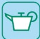
HUILES DE VIDANGE