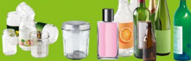
pots / bocaux / flacons / bouteilles