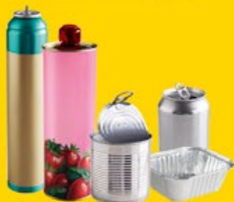
acier / aluminium