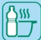
HUILES DE FRITURE