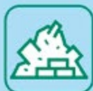
DÉBLAIS / GRAVATS