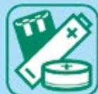
PILES ET ACCUMULATEURS