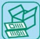
PAPIERS / CARTONS