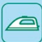
PETITS APPAREILS MÉNAGERS