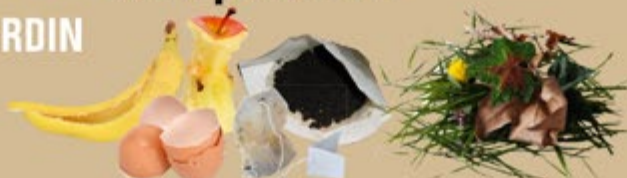
épluchures, coquilles d'œuf, filtres à café, thé, feuilles, fleurs...

Pour acheter un composteur individuel (livraison à domicile) ou + de renseignements, contactez le service Déchets de la CC Loue Lison au 03 81 57 16 70 ou 03 81 63 84 63