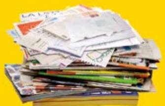
journaux / magazines prospectus / catalogues cahiers / feuilles enveloppes