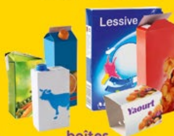
boîtes cartonnettes briques alimentaires