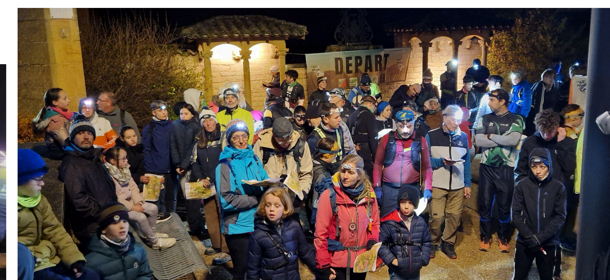
Les coureurs écoutent les consignes avant le départ