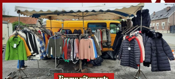
Jimmy vêtements 0651695760