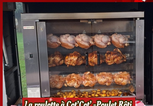
La roulette à Cot'Cot' - Poulet Rôti 07 68 00 40 51