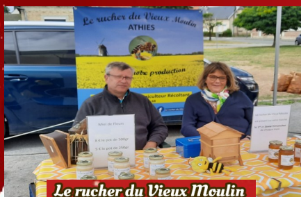
Le rucher du Vieux Moulin 06 19 81 12 68