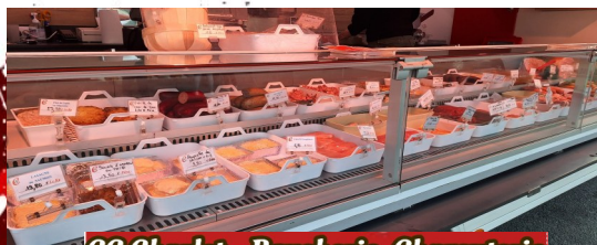
CC Charlet - Boucherie, Charcuterie 06 13 39 28 43