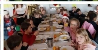
Repas de Noël des enfants de la maternelle le vendredi 19 décembre 2025