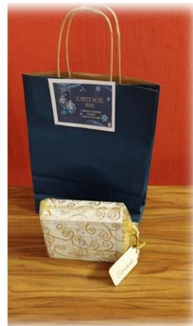
LES COLIS DE NOEL