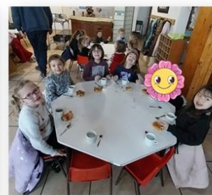
Le goûter des enfants de la maternelle le mardi 16 décembre 2025