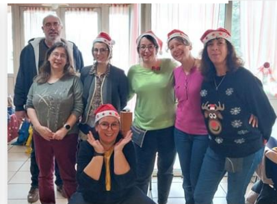
Repas de Noël des enfants de la primaire le jeudi 18 décembre 2025