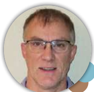
2 ÈME ADJOINT