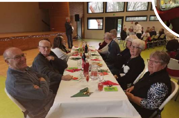
Les convives du jour ont notamment pu apprécier les décorations de Noël installées dans la salle