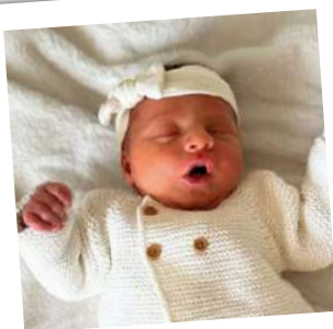
Ava Vespa 6 Janvier 2025