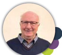
1 ER ADJOINT