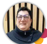
4 ÈME ADJOINTE