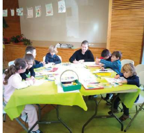
Activité organisée au moment de l'exposition annuelle

Notre association a pour but d'initier des amateurs de mycologie et de nature. Leur donner des informations pour leur sécurité est la première chose que nous faisons, la formation de nos adhérents et du public aux dangers que peuvent représenter certains champignons qui peuvent être toxiques, voire mortels est primordiale. Il y a encore trop d'accidents avec des séquelles graves pour des personnes imprudentes ou mal informées.