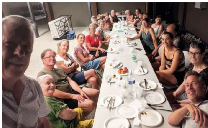
Petit souvenir de l'AG 2025

Le bureau de l'association Gym pour Tous