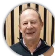
3 ÈME ADJOINT