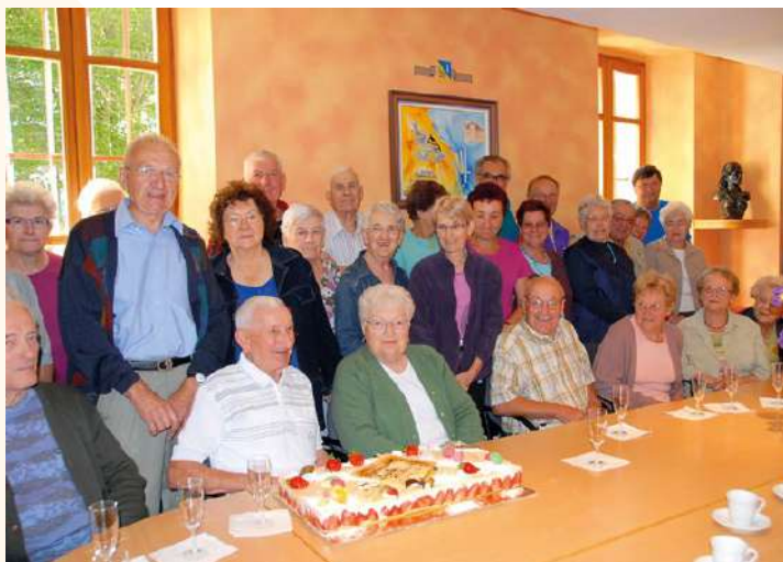
"maintenir des liens d'amitié " avec la célébration des anniversaires