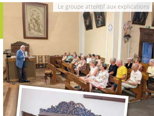
Le groupe attentif aux explications

Longtemps oubliés au profit d'un orgue électronique, ces deux harmoniums font aujourd'hui l'objet d'une attention particulière. Conscient de leur intérêt historique et culturel, le conseil municipal a décidé de déposer une demande de classement au titre des Monuments Historiques, afin d'en assurer la protection et la préservation pour les générations futures.