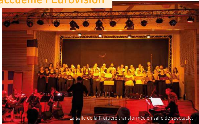
La salle de la Fruitière transformée en salle de spectacle.

quatuor à cordes, piano, batterie, en plus d'être sonorisés et mis en valeur par de belles lumières. Comme d'habitude, vint le temps de la trêve estivale. Septembre et nous revoilà ! Au travail ! Marigny en Chœur participait à un concert avec l'Ensemble Vocal de Frontenex à Montmélian où nous reçûmes un accueil chaleureux. Puis nous mettions dans nos