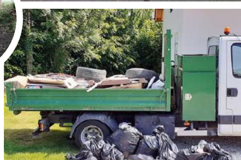
Quelques clichés souvenirs des précédentes éditions