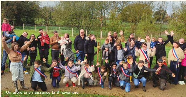
Un arbre une naissance le 8 novembre