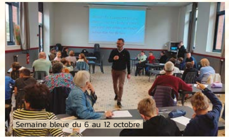
Semaine bleue du 6 au 12 octobre