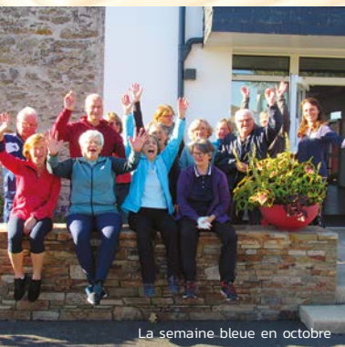
La semaine bleue en octobre