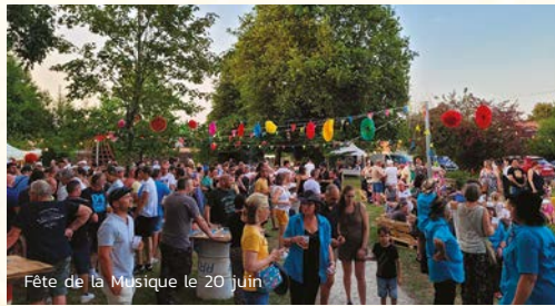
Fête de la Musique le 20 juin