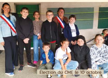
Élection du CME le 10 octobre