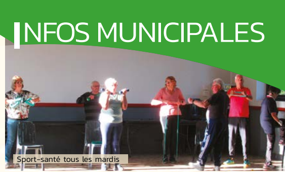
Sport-santé tous les mardis