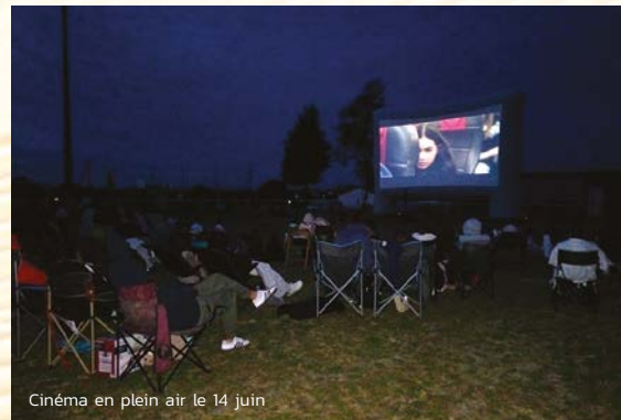
Cinéma en plein air le 14 juin