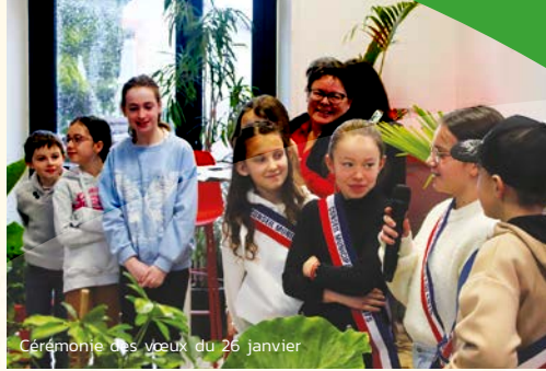
Cérémonie des vœux du 26 janvier