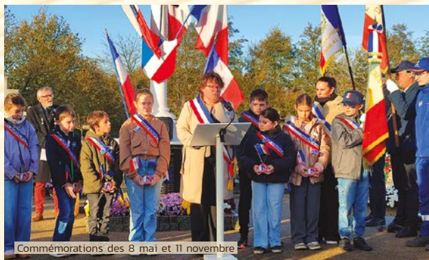
Commemorations des 8 mai et 11 novembre