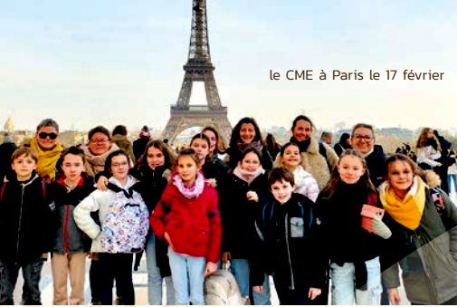
le CME à Paris le 17 février