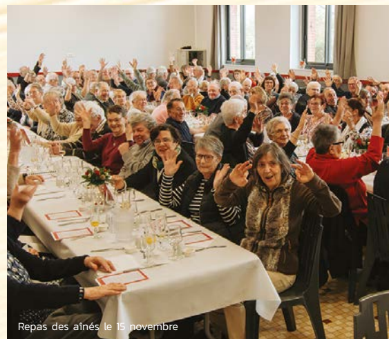
Repas des aînés le 15 novembre