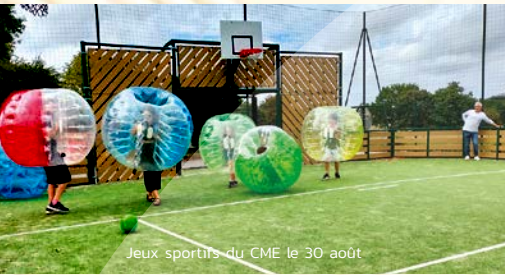
Jeux sportifs du CME le 30 août