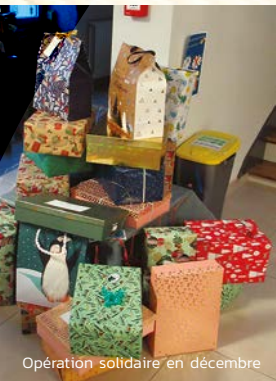
Opération solidaire en décembre