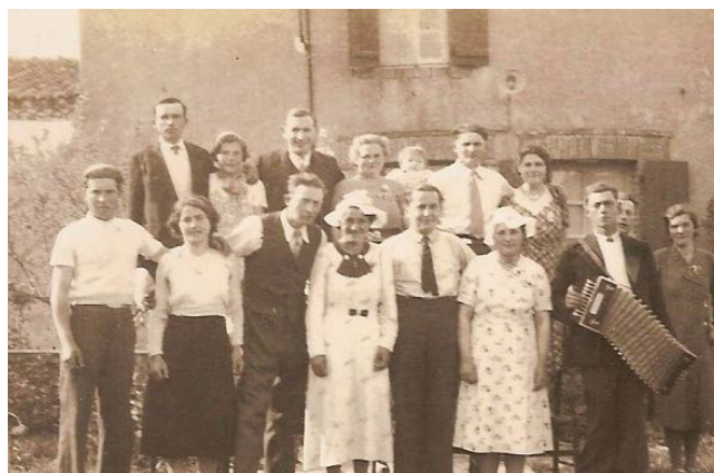
Rencontre festive à la Petite-Borderie au son de l'accordéon