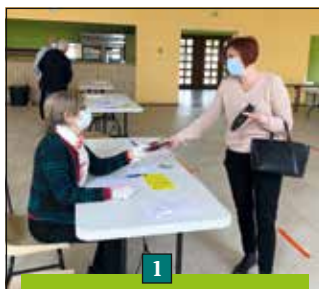
1 2020 - Gestion de la crise sanitaire COVID19