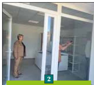
2 2020 - Création local pour le Comité des fêtes : 10 300 € TTC