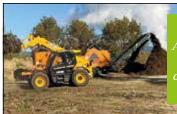
6 2021 - Aménagement site dépôt déchets verts : 1 104 € TTC