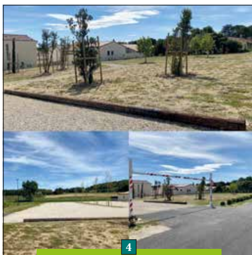
4 2021 - Aménagement paysager + parking : 58 284 € TTC