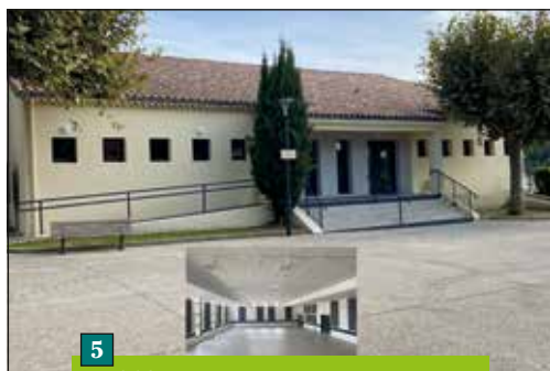
5 2021 - Réhabilitation et mise en accessibilité salle des fêtes : 703 616 € TTC