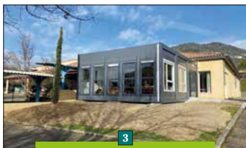
3 2021 - Agrandissement cantine : 16 200 € TTC