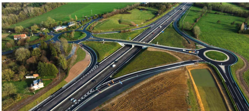
Le nouvel échangeur de la Haie Tondue : ouverture en janvier 2026