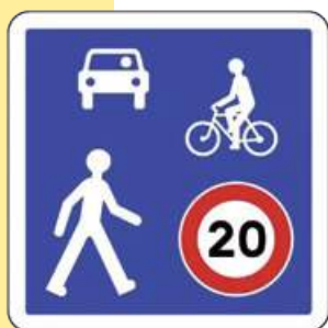
Panneau zone de rencontre