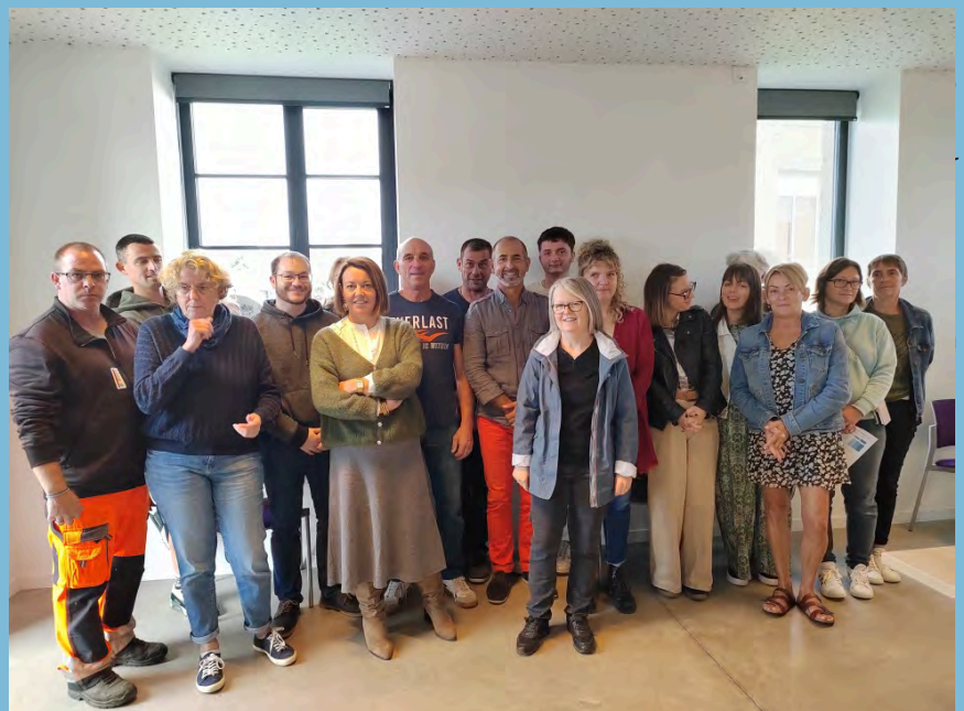
L'équipe des agents municipaux au service des habitants de Tréliván