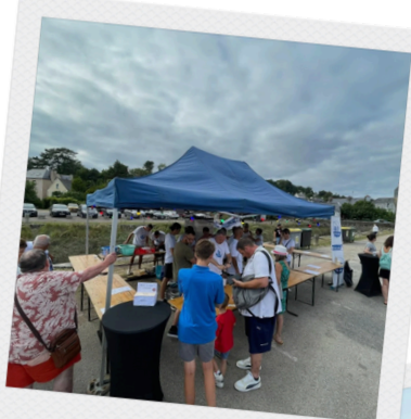
Marché nocturne 2025

Pendant ces marchés nocturnes plusieurs artisans étaient également présents pour vous présenter leurs produits.