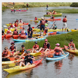
Au fil de l'eau 29 juin 2025