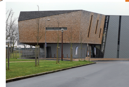
Maison de Quartier Grande Ouche CLIC Loire-Acheneau.

Pour Le Pellerin, Saint-Jean-de-Boiseau et Saint-Aignan de Grand Lieu : nécessité de prendre rendez-vous au préalable en téléphonant au 02 40 69 41 10 avant le vendredi à 12 h précédant le jour de la permanence.