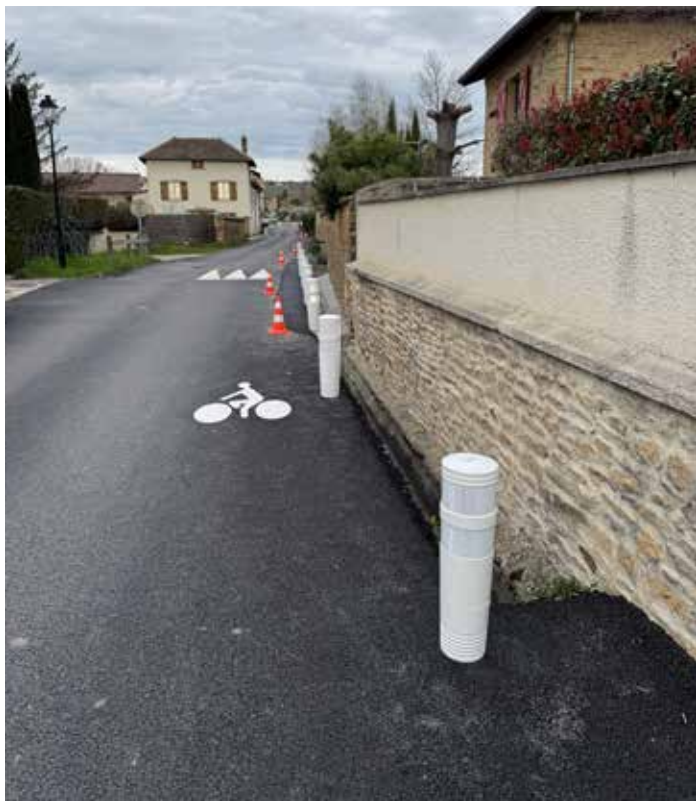
Rue des Cadots

Fin de l'aménagement de la rue des Cadots et en particulier sécurisation des bas-côtés.