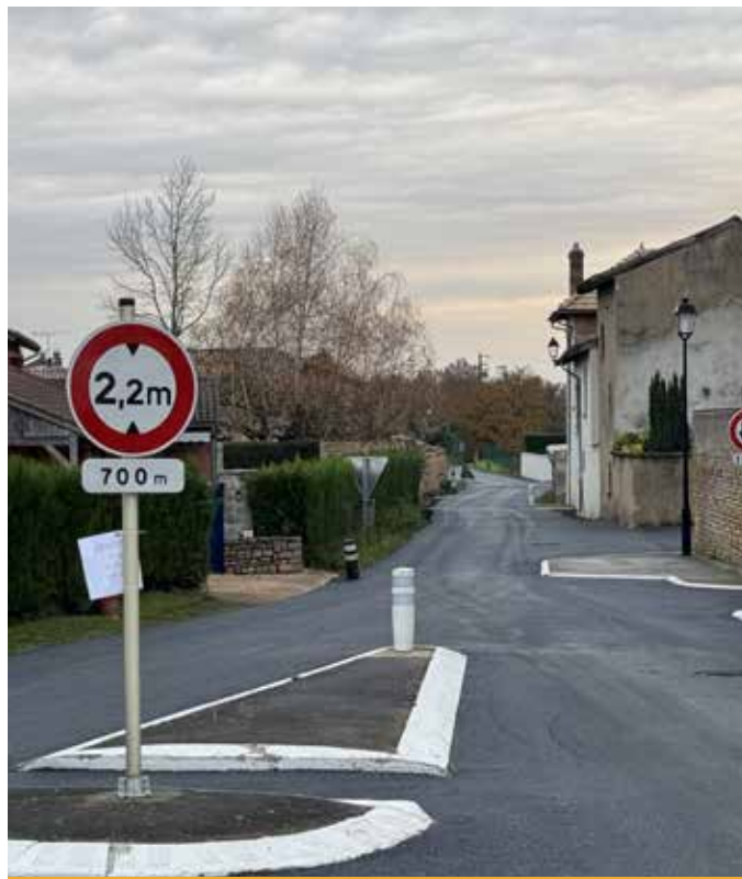
Rue des Cadots