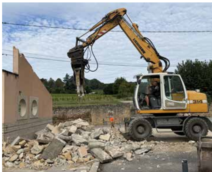
Parvis de la Mairie et de l'école (au 30/11/2025)