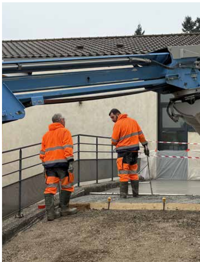
Salle des fêtes