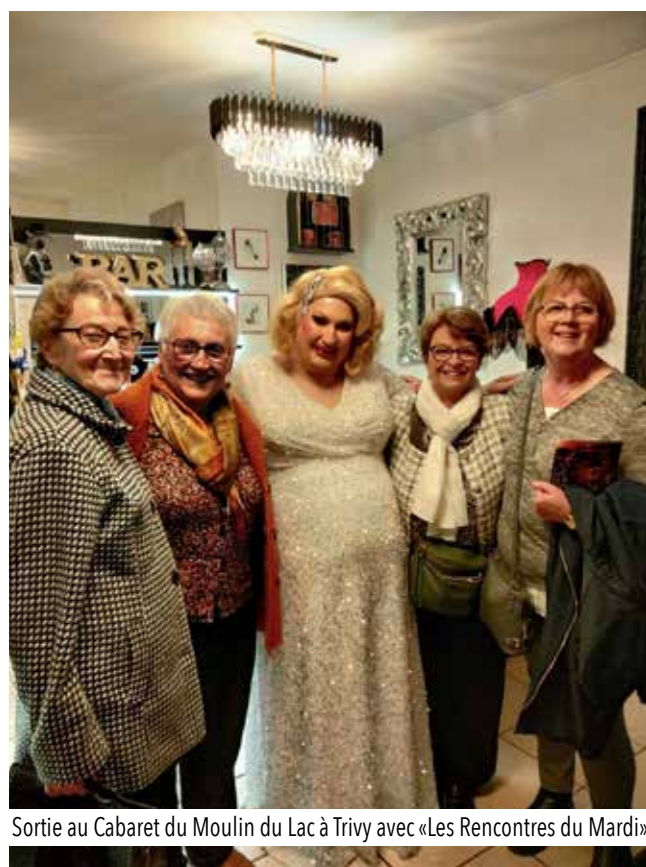
Sortie au Cabaret du Moulin du Lac à Trivy avec «Les Rencontres du Mardi»