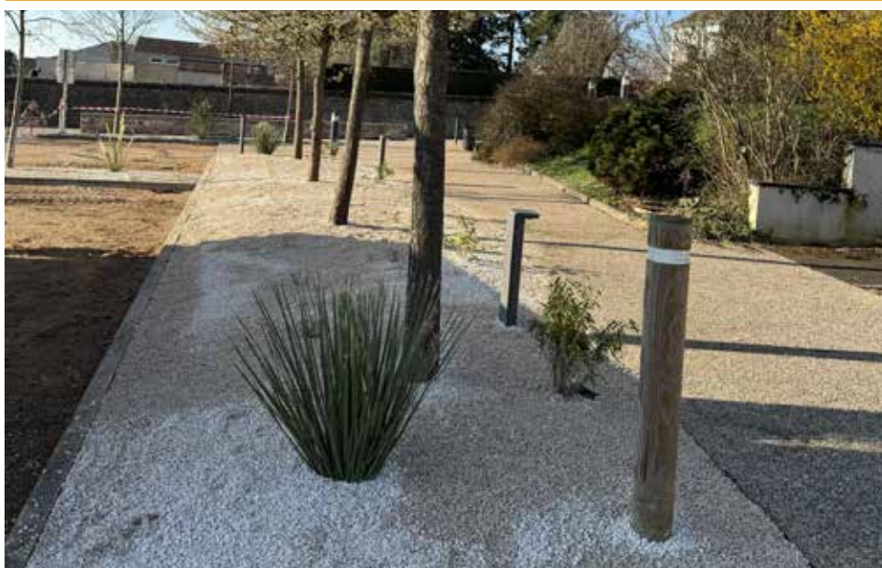
Réfection des massifs végétalisés du parking de la Cense.