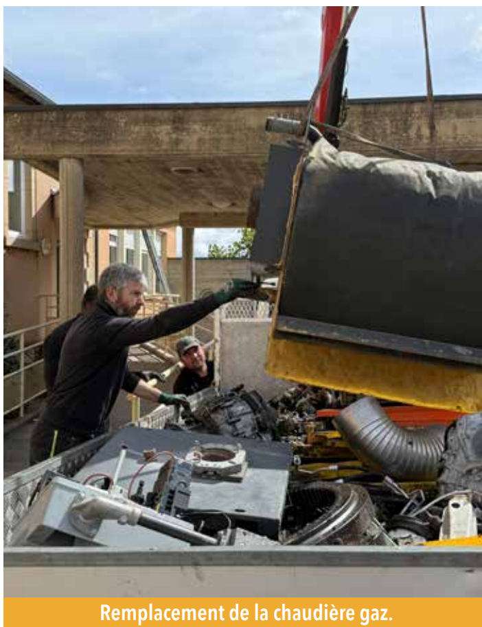
Remplacement de la chaudière gaz.