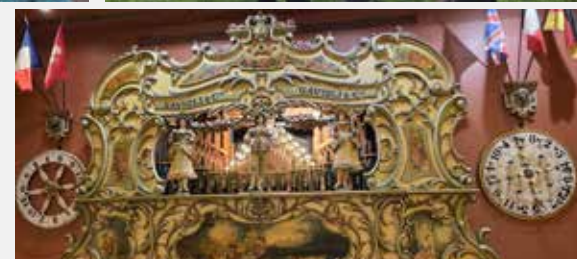
Journée à Romanèche

Être bénévole à l'ADMR c'est une expérience humaine riche de sens qui permet à vos familles, vos amis, vos voisins... de bien vivre chez eux, dans les meilleures conditions possibles.