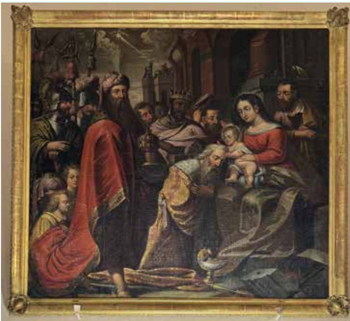
Adoration des mages. École hollandaise XV- XVI siècle.

Sur la façade ouest la porte est encadrée de chaque côté par une colonne dégagée. Pas de tympan décoré, l'oculus domine la tribune intérieure. Avant les travaux de réfection de la toiture on pouvait distinguer le dessin d'une croix sur le clocher à 4 pans. Des baies romanes en plein cintre éclairent l'intérieur. Le bord inférieur du toit repose sur une corniche accompagnée de modillons.