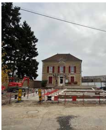
Parvis de la Mairie et de l'école