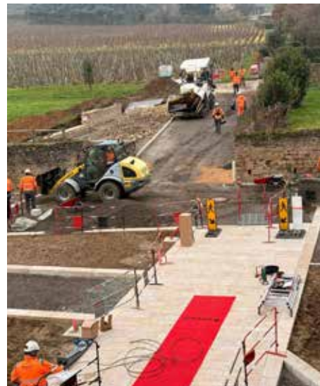
Parvis de la Mairie et de l'école