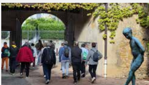
Marche des bénévoles à Charolles