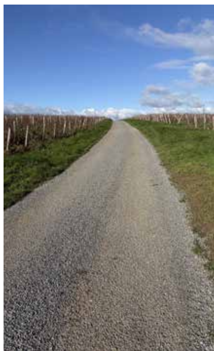
Rue du Cimetière

Après reprofilage en 2024, réalisation des enduits rue du Cimetière et en partie basse du haut du chemin de la Dame.