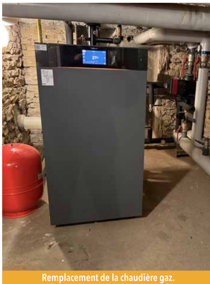
Remplacement de la chaudière gaz.