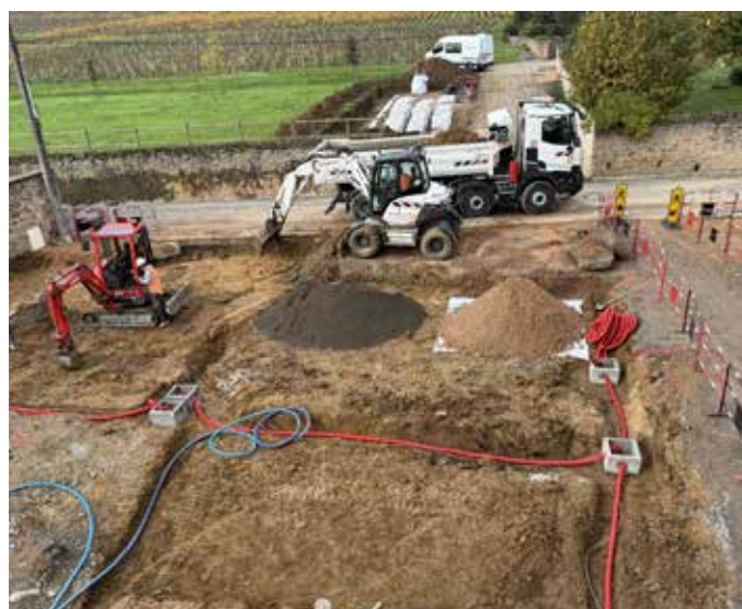
Parvis de la Mairie et de l'école (au 30/11/2025)