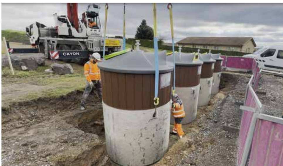
Second PAV (Point d'Apport Volontaire) rue des Buchardières.