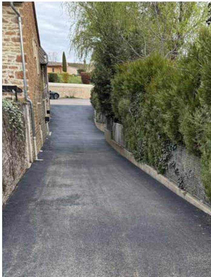
Impasse du Bourg

Aménagement de l'arrière de la salle des fêtes permettant, si besoin, l'implantation d'un barnum.