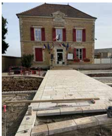
Parvis de la Mairie et de l'école