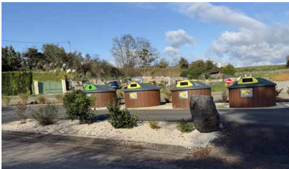
Second PAV (Point d'Apport Volontaire) rue des Buchardières.