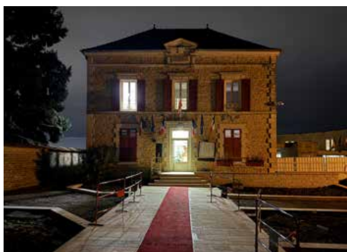
Parvis de la Mairie et de l'école