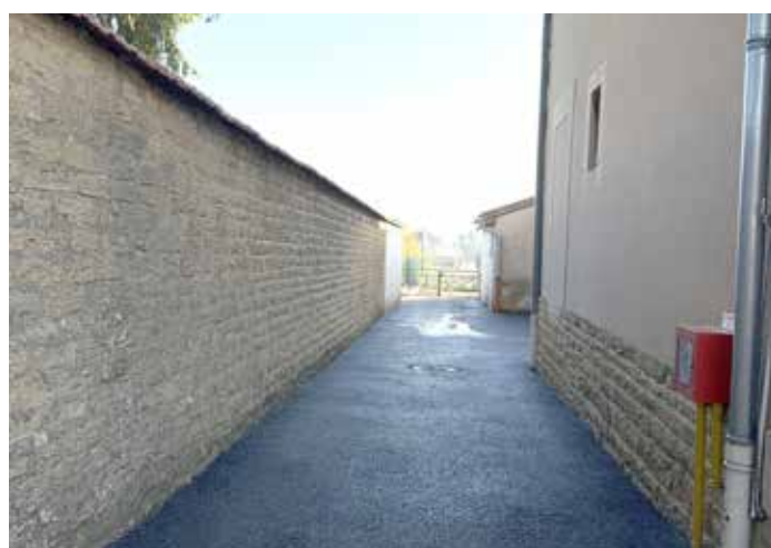
Impasse accès au restaurant scolaire