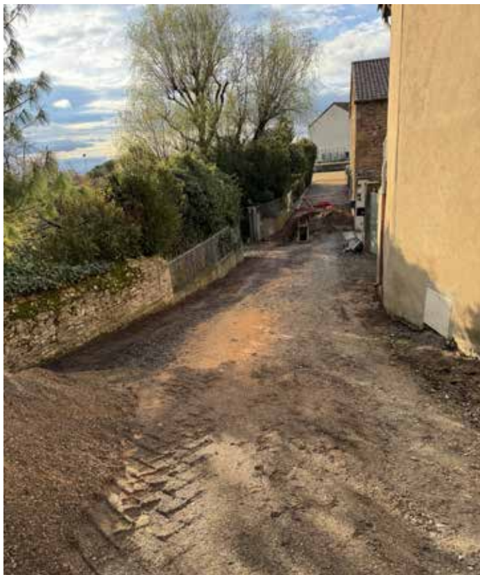
Impasse du Bourg

Réfection complète de l'impasse du Bourg comprenant l'évacuation des eaux pluviales et l'installation d'un éclairage public.