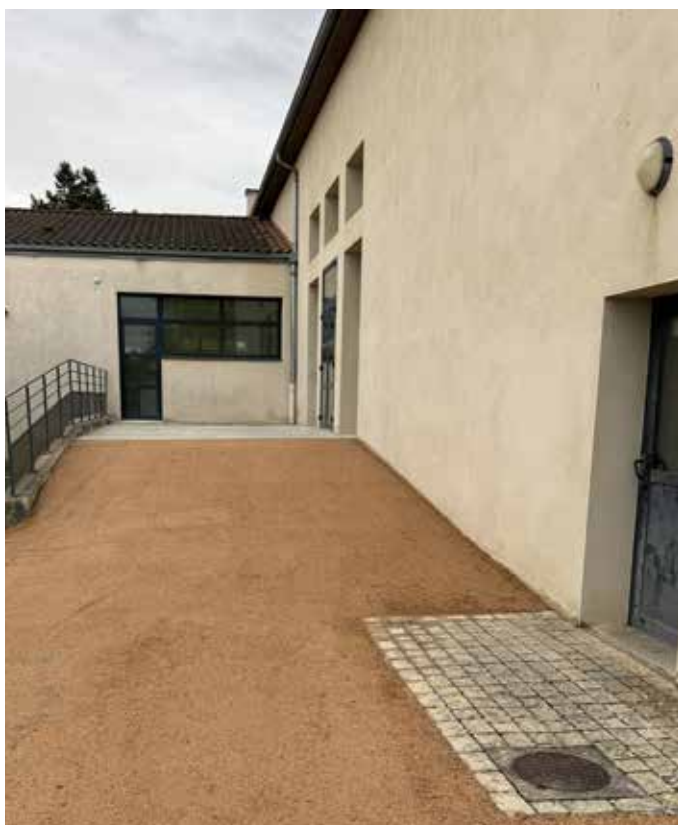
Salle des fêtes

Aménagement de l'arrière de la salle des fêtes permettant, si besoin, l'implantation d'un barnum.