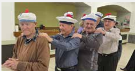
Après-midi récréative pour les bénéficiaires