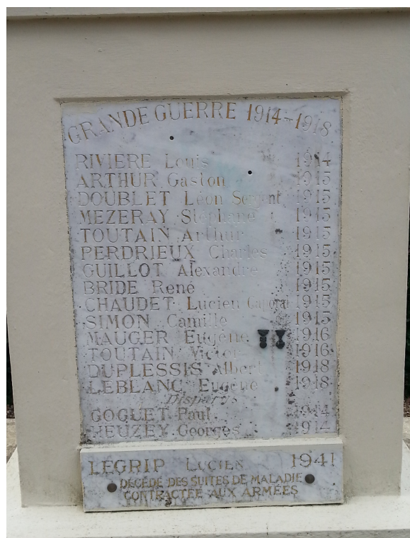
Plaque commémorative des soldats Morts pour la France sur le monument de Glanville