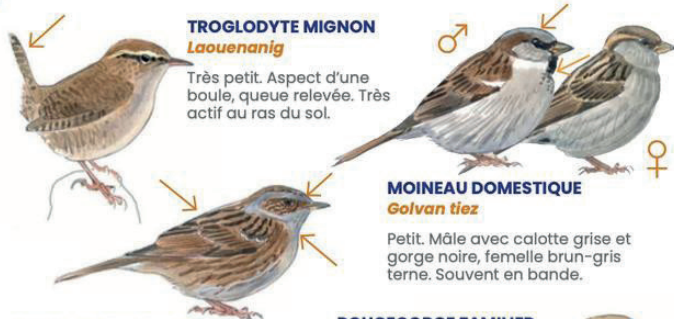
TROGLODYTE MIGNON Laouenanig

Très petit. Aspect d'une boule, queue relevée. Très actif au ras du sol.