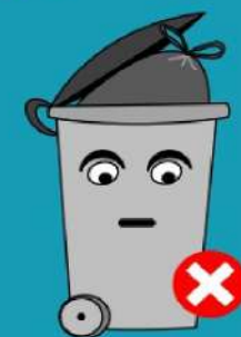
BAC NON FERMÉ