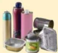
EMBALLAGES MÉTAL et ALUMINIUM