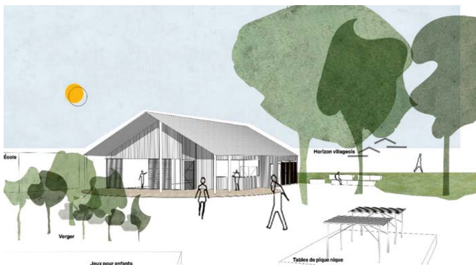
Croquis d'intention de la halle, implantée derrière l'école, entre le stade municipal et l'aire de jeux. Crédits : Studio Pili Pili

La volonté des architectes est de construire un bâtiment en bois, qui s'intègre au paysage du centre-bourg, notamment en utilisant des matériaux biosourcés. Un travail paysager de requalifi-