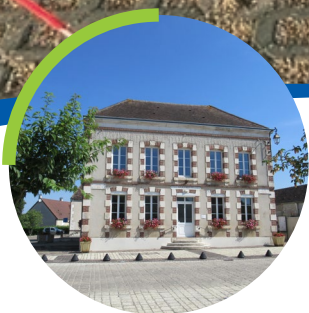
INFOS DES ÉLUS p.4