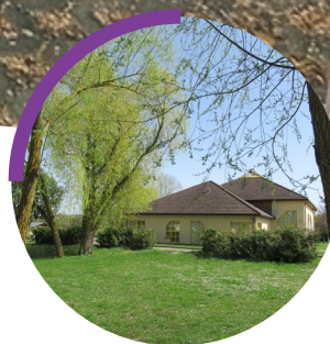
VIE ASSOCIATIVE p.10