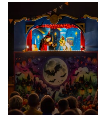
Les enfants captivés par le théâtre de marionnettes.