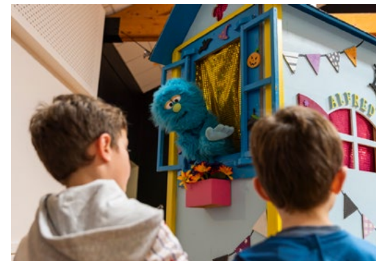
La marionnette Alfred accueillant les spectateurs.

Enfin, nous tenons à remercier Jean-Michel Largeau pour ses très belles photos du spectacle. Un beau souvenir assurément pour tous les participants, petits ou grands.