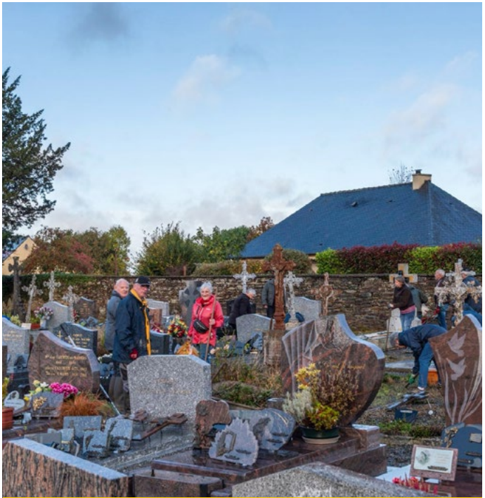
Les bénévoles au travail dans les allées du cimetière.