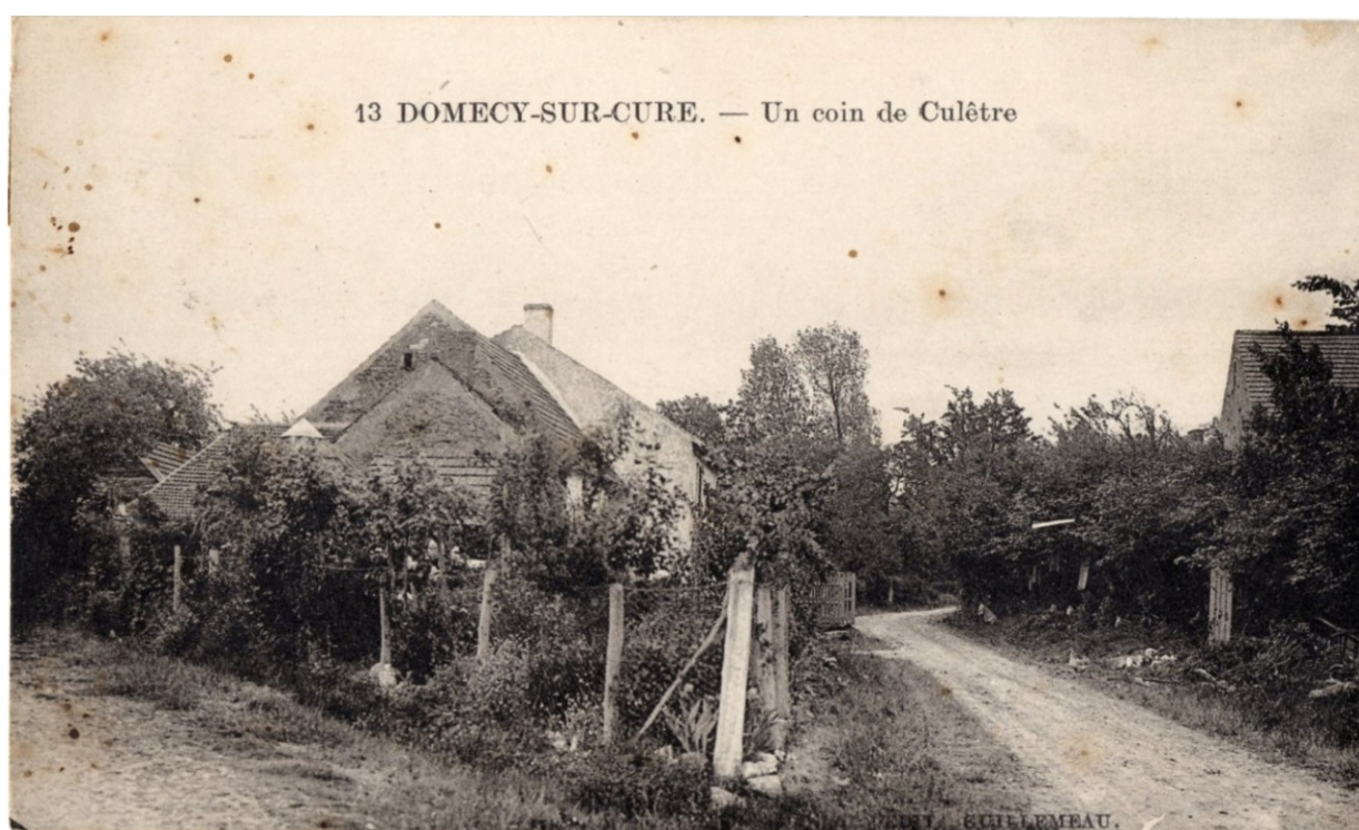
Le hameau de Culêtre vers 1900.