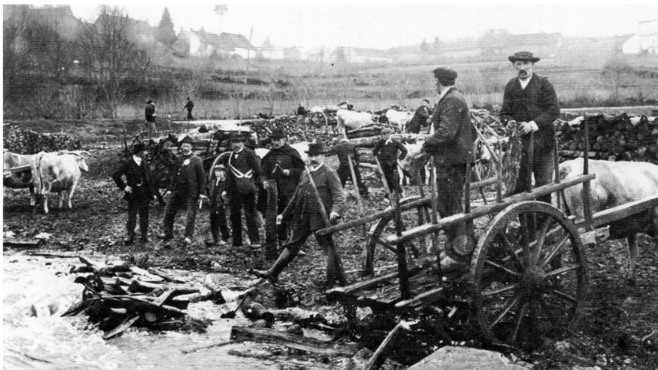
Le flottage en Morvan.

On ne trinque pas avec de l'eau, mais pour une fois, sans modération, à la vôtre !