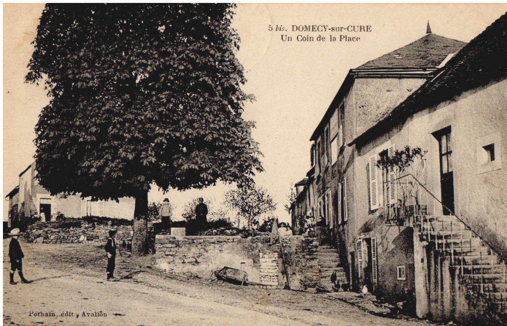
La place de Domecy vers 1900. L'auberge Guyot est située au fond.