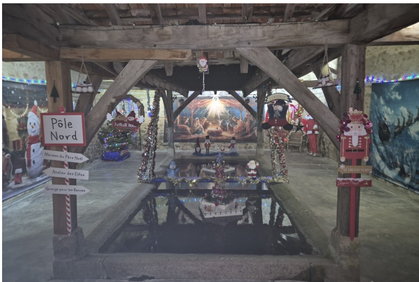
La grande féerie de Noël dans le lavoir d'Usy.

Le JOURNAL de la COMMUNE de DOMECY-sur-CURE