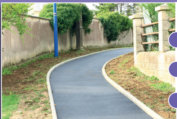
chemin des Mauduys après les travaux