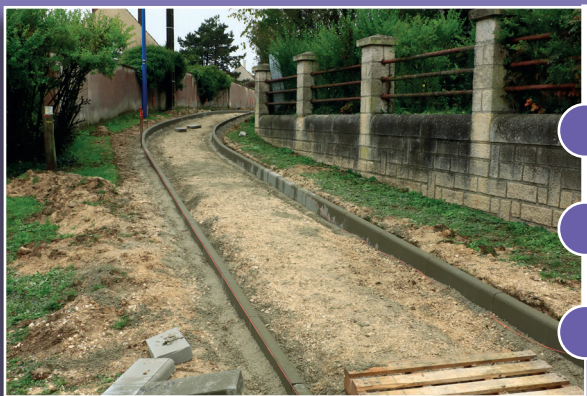
chemin des Mauduys pendant les travaux