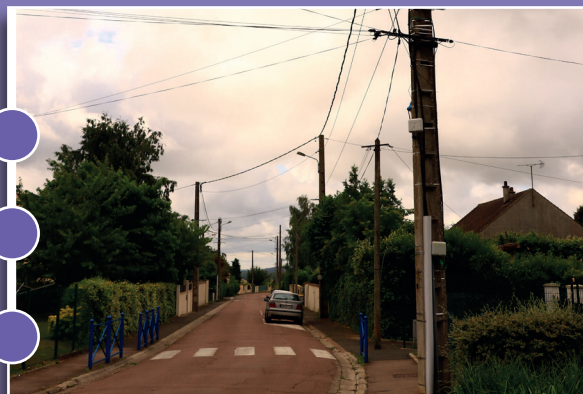
Enfouissement des réseaux