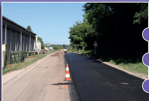
route accès Invivo/Eqiom