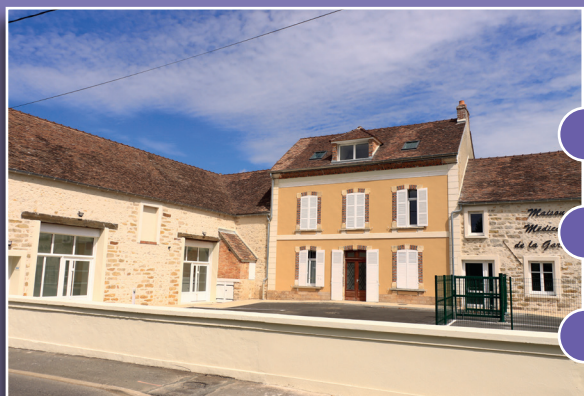
maison médicale La Garenne