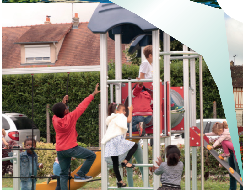
Aire de jeux place du village

BULLETIN MUNICIPAL ANNUEL DE LA GRANDE PAROISSE