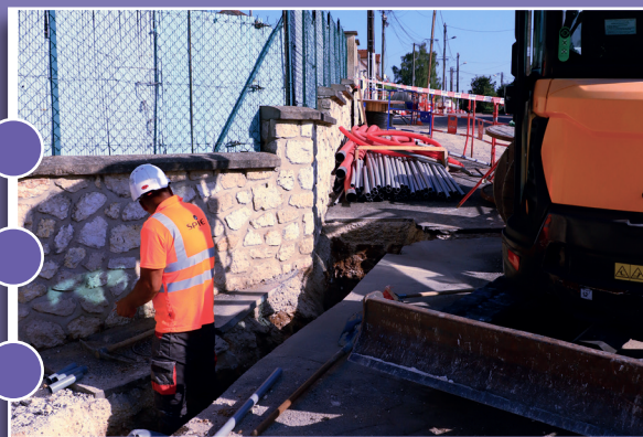
Enfouissement des réseaux