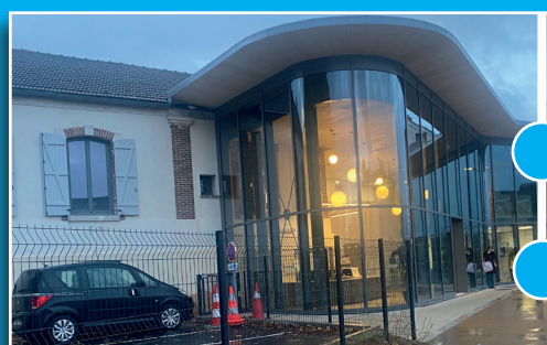
maison de la mobilité à côté de la gare