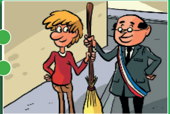
entretenir ensemble !