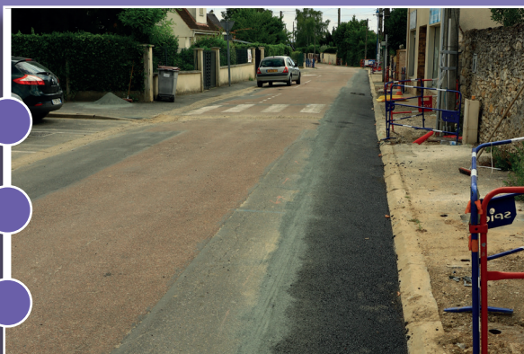
Enfouissement des réseaux