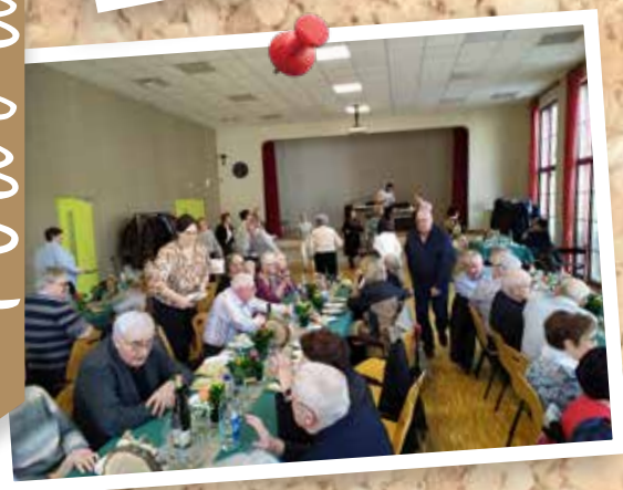
9 février : Fête des Aînés