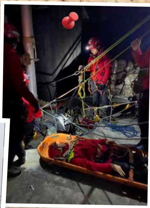
13 mars – 6 novembre : exercices de jour et de nuit des sapeurs-pompiers au Wineck