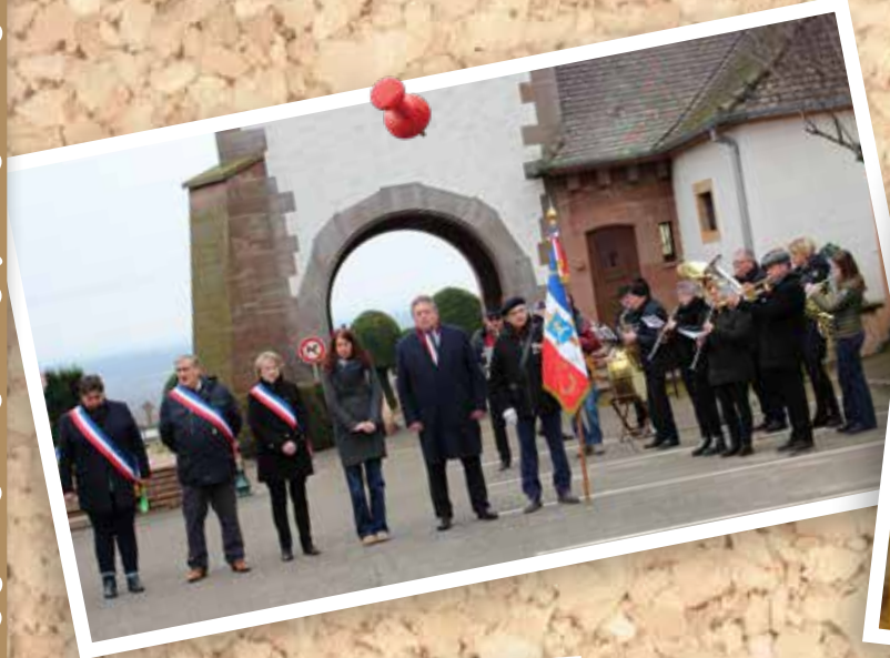
2 février : Cérémonie des 80 ans de la Libération de Katzenthal