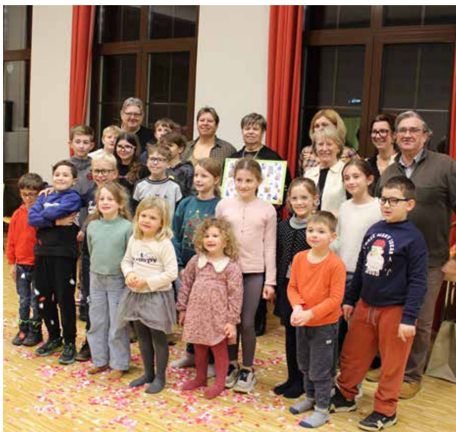
Fête de départ en retraite

Mme Virginie TAVARES est la nouvelle accompagnatrice ; elle a pris ses fonctions le 5 janvier.