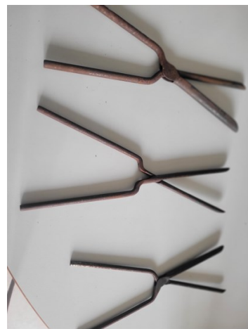
Ci-dessus le casque-sèche-cheveux, à droite un lot de pinces à friser.