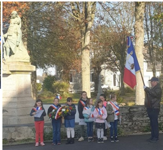
Dépôt de gerbe en présence de Mme le Maire, les porte-drapeaux et les enfants du CME.