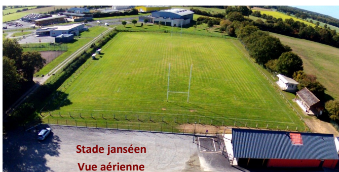
Stade janséen Vue aérienne

Inauguration officielle du terrain de rugby en présence de : (de la gauche vers la droite)