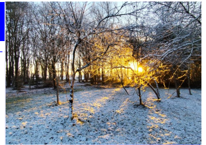
Jans sous la neige le 06/01/2026