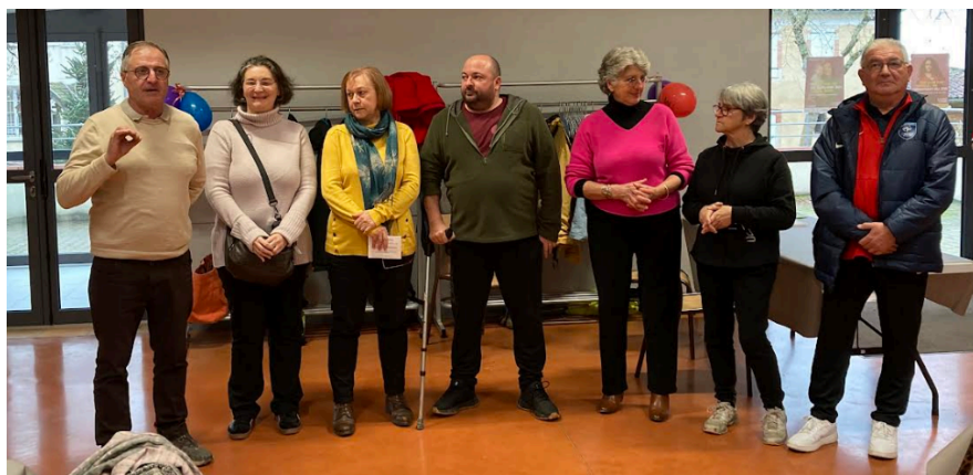
Les représentants des 5 communes ainsi que les Responsables du Téléthon du Gers

Un grand merci à tous pour votre engagement, qui contribue à faire avancer la recherche et aider ceux qui en ont besoin !