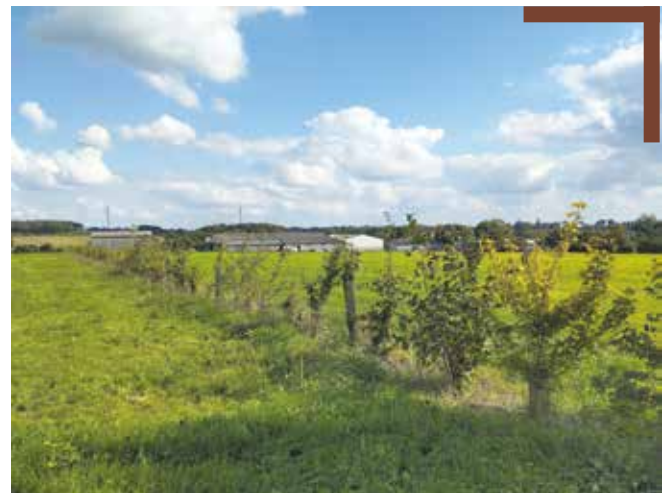
Plantations bocagères du GAEC des Glycines réalisées avec les élèves du lycée agricole de Derval en janvier 2023.

En attendant, place à la croissance de ces haies. Patience... ça pousse !