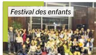
Festival des enfants