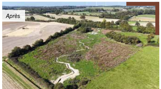
Travaux de reméandrage sur le ruisseau du Pas d'Hin à Derval (avant/après)