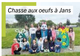
Chasse aux œufs à Jans