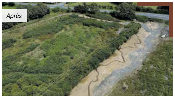
Travaux de reméandrage sur le ruisseau de l'Yene à Derval- Jans (avant/après)