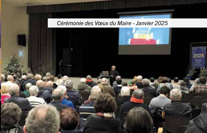
Cérémonie des Vœux du Maire - Janvier 2025