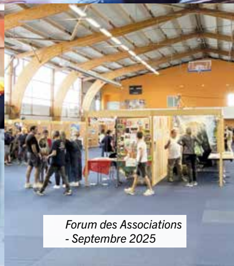
Forum des Associations - Septembre 2025