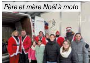
Père et mère Noël à moto