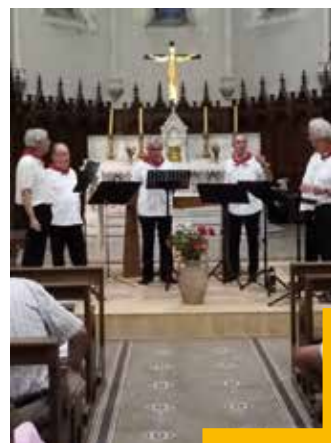
Concert de Vox Ligeri au Grand-Auverné, le 17 août 2025

L'association remercie chaleureusement ses bénévoles, partenaires et participantes, et donne rendez-vous en 2026 pour de nouveaux temps forts.