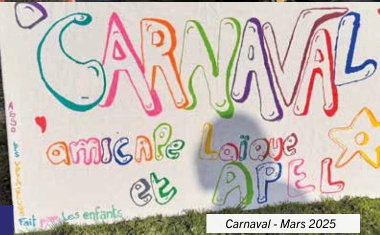
Carnaval - Mars 2025