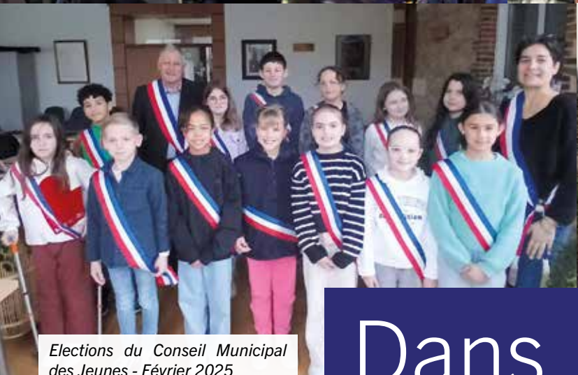
Elections du Conseil Municipal des Jeunes - Février 2025