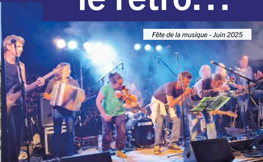
Fête de la musique - Juin 2025