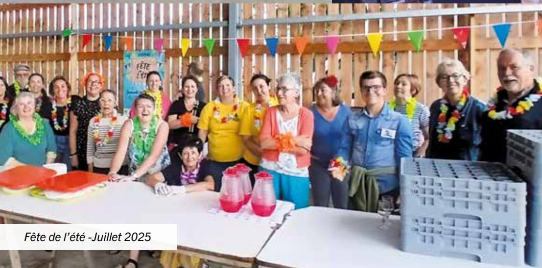
Fête de l'été - Juillet 2025