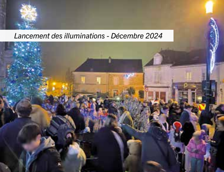
Lancement des illuminations - Décembre 2024