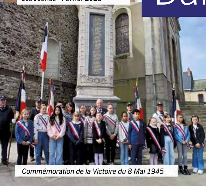
Commémoration de la Victoire du 8 Mai 1945