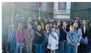
Commémoration du 11 novembre

Chaque année, entre janvier et février, le conseil municipal des jeunes est renouvelé partiellement. Vous avez entre 8 et 13 ans ? N'hésitez pas à vous porter candidat en 2026.