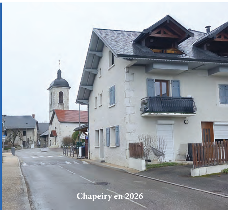
Chapeiry en 2026