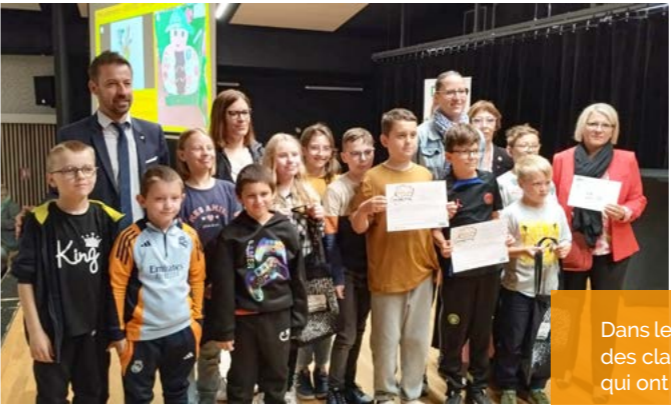
Dans le cadre du concours Mosel'Lire, la Médiathèque les Halles a été le partenaire des classes ULIS et SEGPA de l'école élémentaire du Stade et du collège Pasteur, qui ont remporté le premier prix de leur catégorie ! Félicitations !