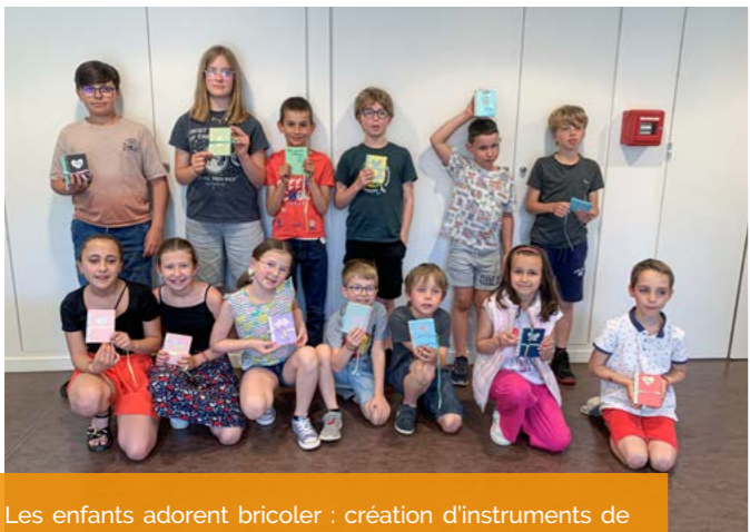
Les enfants adorent bricoler : création d'instruments de musique, des carnets à secrets, des boules de graines pour les oiseaux...