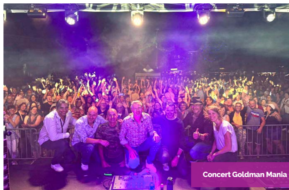
Concert Goldman Mania

Dans le cadre de la lutte contre le harcèlement, la lutte contre les préjugés et l'acceptation des différences, les enfants de l'école maternelle du Bas-Steinbesch forment un cœur pour souhaiter à tous une bonne année à venir.