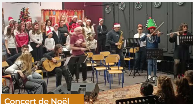
Concert de Noël

L'école de musique a proposé son traditionnel concert de Noël, le samedi 13 décembre, à 18h, au Gymnase Culturel.