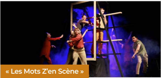
« Les Mots Z'en Scène »

La troupe Les Mots Zélés a organisé un festival de théâtre du 31 octobre au 10 novembre au Gymnase Culturel, avec une programmation de sept spectacles pour tous les goûts.