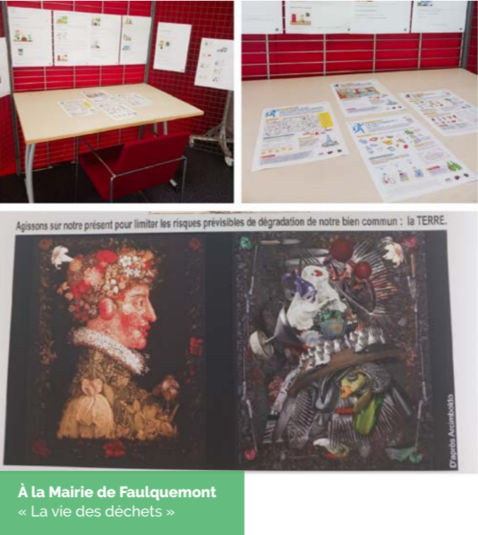
À la Mairie de Faulquemont « La vie des déchets »

Pour sa première participation aux Semaines vertes, Faulquemont a proposé un programme riche et varié, soutenu notamment par l'implication des agents techniques en charge de l'arboretum, lors d'une présentation le samedi 27 septembre. Le public a pu profiter pour admirer des expositions, empruntées au Département de la Moselle.