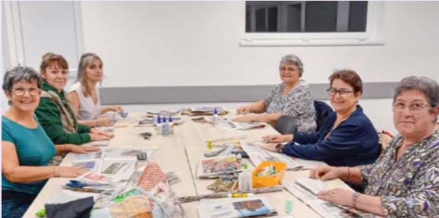
Pas'Sages à l'acte Depuis septembre, du nouveau à Chémery ! L'association « Pas'Sages à l'acte » propose désormais un nouveau temps fort, en plus des deux séances de gym du jeudi : des loisirs créatifs tous les mardis soir.