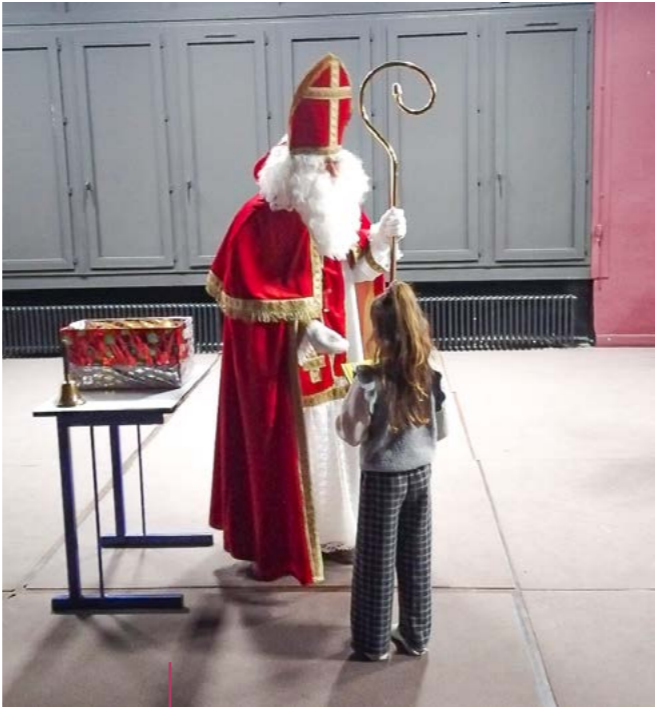
Saint Nicolas à l'école du Bas-Steinbesch