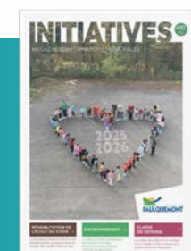
Légende de la couverture :

Dans le cadre de la lutte contre le harcèlement, la lutte contre les préjugés et l'acceptation des différences, les enfants de l'école maternelle du Bas-Steinbesch forment un cœur pour souhaiter à tous une bonne année à venir.