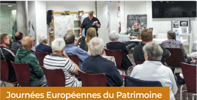
Journées Européennes du Patrimoine