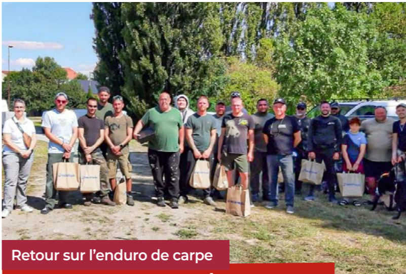
Retour sur l'enduro de carpe de l'AAPPMA Faulquemont

Ethan Thouvenin, licencié à l'ESCF athlétisme depuis 2019, a participé cet été au 31 e championnat du monde d'Icosathlon à Besançon et a brillamment remporté le titre de champion du monde le 13 juillet 2025 (17 nations participaient à cet événement). Pour beaucoup d'entre nous, cette discipline est méconnue, mais on peut dire tout simplement que ça équivaut à deux décathlons, mais avec les disciplines de l'athlétisme (12 courses, 4 lancers et 4 sauts) et tout ça en maximum deux jours et en terminant par un 10 000 mètres. Autant dire qu'il faut faire preuve de persévérance dans ce type d'efforts et Ethan a montré beaucoup de courage et de ténacité dans son parcours. Saluons justement Damien Tragus, son entraîneur, qui l'a emmené au plus haut et Jean-Marc Krebs, président très fier de cette performance. Bravo Ethan !