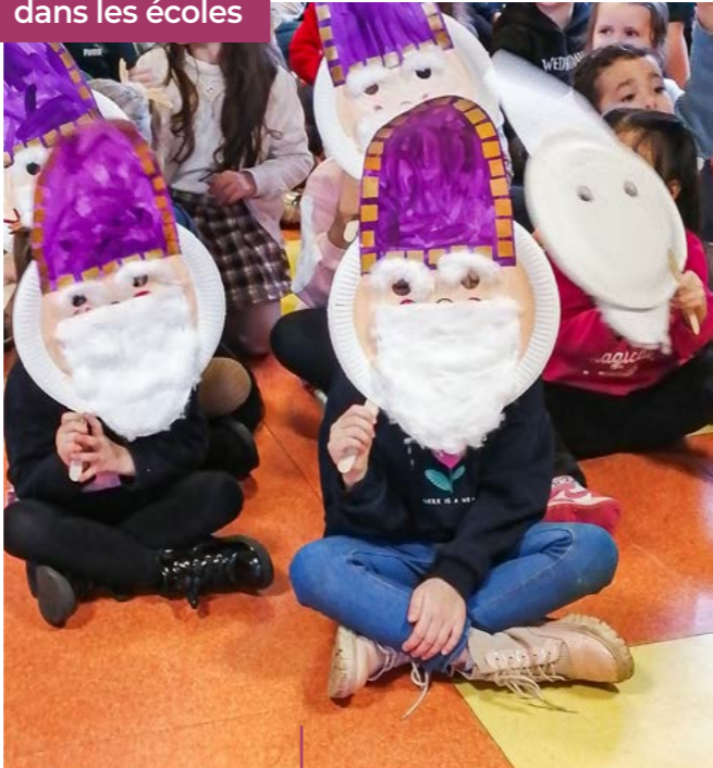
Saint Nicolas à l'école du Stade