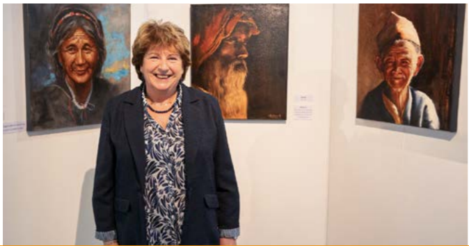
Art et couleurs de Chantal Keldenich, Ombre et lumière de Priscilla Stein et Regards de photographes du club Réflexes Images