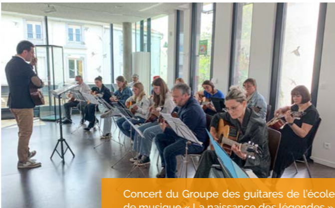
Concert du Groupe des guitares de l'école de musique « La naissance des légendes »