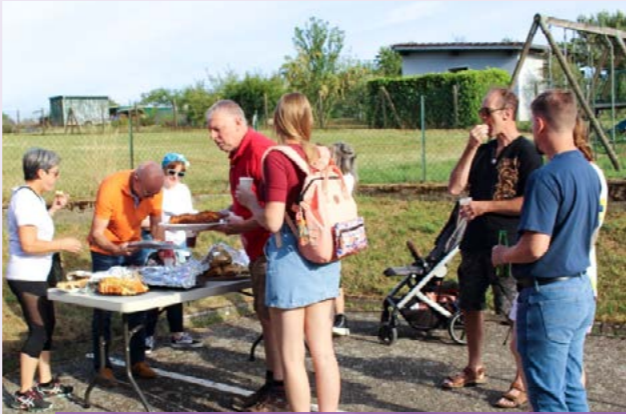
Fête de l'été La première fête de l'été, organisée par l'association, a eu lieu le 12 juillet à Chémery.