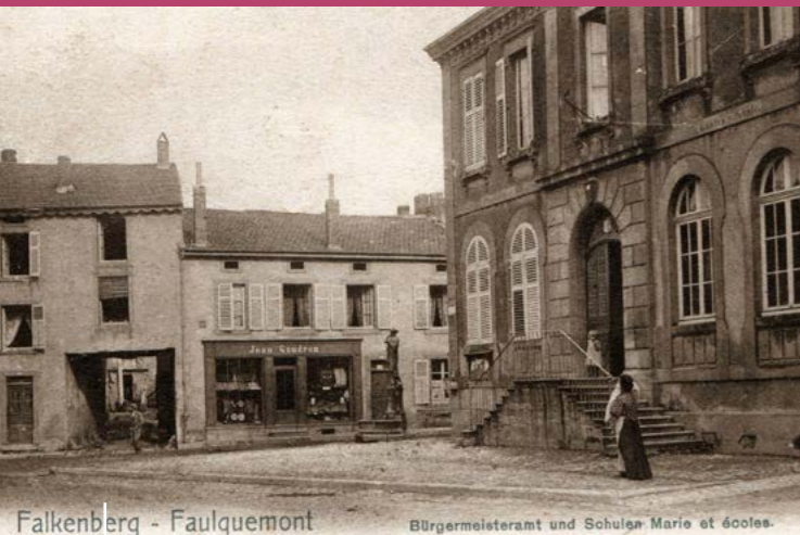
L'école des garçons de Faulquemont

Dès l'achat du Marquisat de Faulquemont par le Comte et la Comtesse de Choiseul, la marquise en 1751, se préoccupe de l'instruction sur son territoire. A Faulquemont la marquise rémunère un instituteur (qui était payé «une demi-charrue» mesure de distance et de d'argent) pour instruire les administrés, engagea même des sommes plus importantes pour assister pécuniairement les élèves méritants de Faulquemont vers des séminaires ou autres. Elle comprit très tôt l'importance de l'instruction dans la valorisation de son domaine.