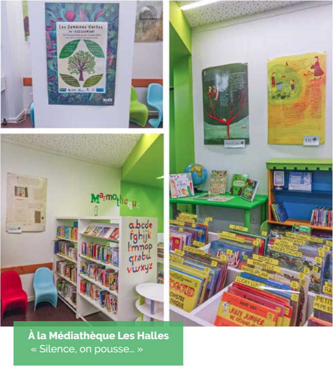
À la Médiathèque Les Halles « Silence, on pousse... »