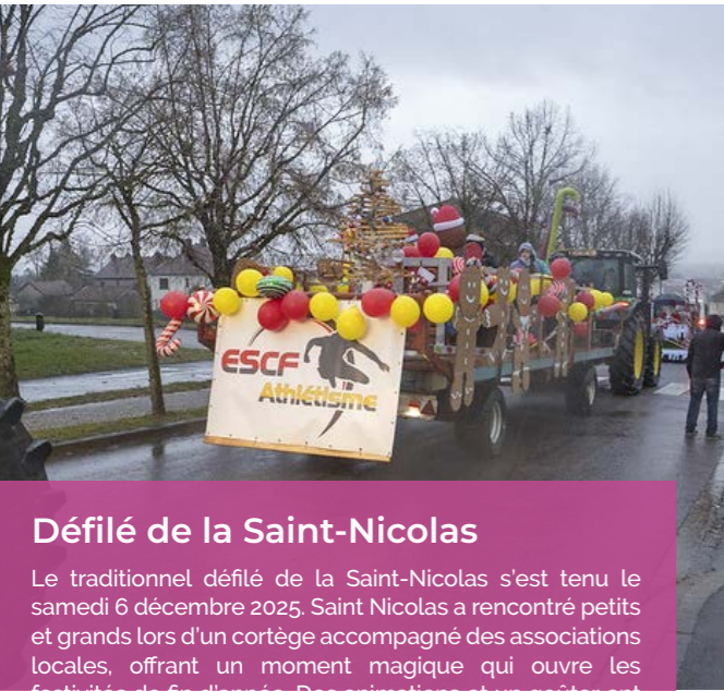
Défilé de la Saint-Nicolas Le traditionnel défilé de la Saint-Nicolas s'est tenu le samedi 6 décembre 2025. Saint Nicolas a rencontré petits et grands lors d'un cortège accompagné des associations locales, offrant un moment magique qui ouvre les festivités de fin d'année. Des animations et un goûter ont également été proposés à la population.