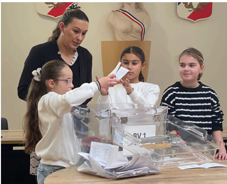
Les membres du Conseil Municipal des Jeunes (CMJ) procèdent au dépouillement.